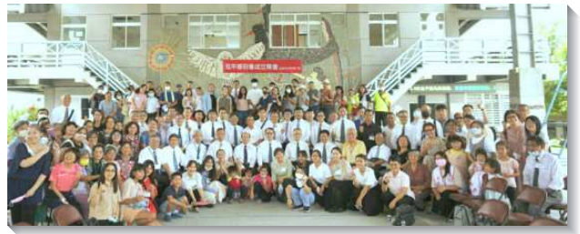
▲台東縣延平鄉召會於二〇二二年七月十七日成立

到了今年一月，疫情趨緩，弟兄們隨即交通，安排全時間學員至當地有為期四週的福音開展。開展結束後，五個會所的聖徒利用每週五至主日，輪流前往接續牧養。接著在三月底再申請一隊全時間學員前去有五週開展行動。開展後，原本規劃仍由五個會所的聖徒輪流前