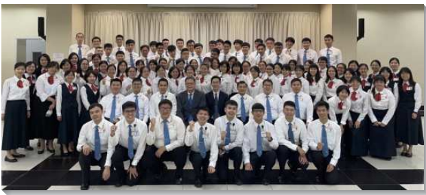
▲青職聖徒在忠義訓練中心參加短期訓練

自開放報名以來，即收到全台各地二百餘位聖徒踴躍報名，著實看見眾多青年人渴慕受主的成全，至終共有一百五十五位青職聖徒有分實體訓練，分別於三會所與忠義訓練中心受訓。感謝主，在主的保守與看顧下，五天四夜的訓練得以順利進行，沒有任何學員染疫。