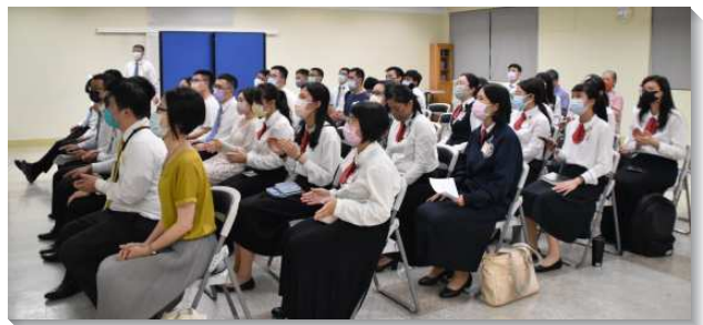
▲青職聖徒參加全時間短期訓練

本次訓練不僅有各面平衡的課程、生活內務的評比，更規劃了固定的外出福音開展時段，以及福音收割聚會。每一天下午的課程結束後至晚餐前，學員分隊到訓練中心周邊，以及各捷運站人潮聚集處，操練向人傳講福音。有些青職聖徒從未使用過『人生的奧祕』，直至此次才有機會突破，使用這本小冊向人傳講福音，嘗到向人湧流生命的喜樂。學員也操練配搭舉辦福音聚會，雖僅短短的三天豫備，至終，兩地四場的福音聚會有二十位福音朋友前來，且有五位信主受浸得救，主所作的超過我們所求所想。