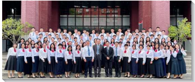
▲青職聖徒在三會所參加全時間短期訓練

在核心真理的追求上，本次特別以六堂課，進入主僕李常受弟兄於一九九五年十月所釋放『為著基督身體之建造十大緊要的一』的信息。這十大緊要的一包羅且深廣，學員們得蒙開啓看見主恢復真理的水平，以及新約職事的寶貴與豐富。生命系列信息，學員們認識『生命憑著規律而長大，以致成熟並盡功用』，因而樂意受訓練時間表的限制。『老舊和意見與啟示和順服相對』這堂課使許多學員蒙光照，願意更多受對付並倒空自己。『事奉主者性格的建立』幫助學員更看重訓練中每一項性格的操練，而更竭力豫備自己成為合乎主用的器皿。