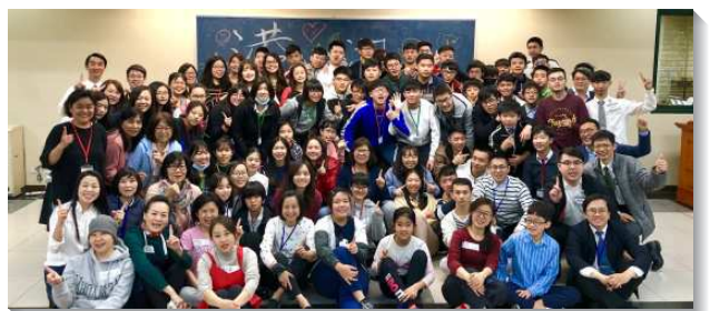
▲港湖區中學生暑假特會

在特會結束後，就有青少年結伴參加週一到週六清早六時三十分起，一小時的禱研背講並錄影訓練，以及週末、主日的列王紀結晶現場訓練。盼望主繼續在青少年裏面作工，為著祂的建造，把他們作成柱子和建造柱子的人，成為祂的得勝者，將祂迎接回來。（陳芝庭）