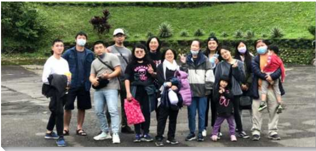
▲青職聖徒們邀約福音朋友出外相調

四月份連假我們到平溪鄉，有位弟兄爲了邀約久不聚會的弟兄，特地前一天請他到家裏來住，並於隔天早上參加主日，下午出發相調。一位在醫院工作的姊妹，邀