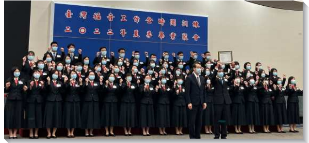
▲全時間訓練畢業學員獲頒畢業證書

本期畢業詩歌—『信心的道路』，主要根據二〇二二年春季國際長老及負責弟兄訓練之信息的啓示與負擔撰寫而成，也說出在兩年訓練中學員們在生命上的經歷與看見，並操練憑信隨主往前。『望斷以及於耶穌』是我