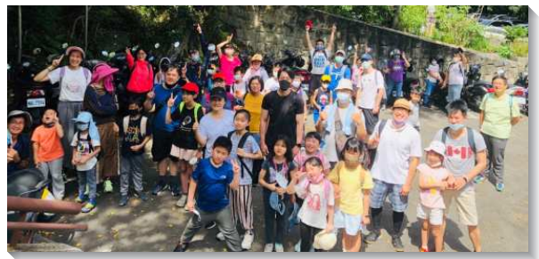
▲聖徒們邀約兒童全家參加親子相調行動

因著疫情，各兒童排在四月開始調整爲線上，許多兒童在鏡頭前不易坐得住，若要邀約初次接觸的親子來參與線上兒童排，更沒有把握。經弟兄們交通，兒童服事需要有積極攻勢，不能再受疫情影響。遂規劃自五月八日主日下午開始，每隔一週的主日下午舉辦全會所兒童活動。線上的活動有摺紙科學、搓愛玉、馬賽克拼貼等手作活動。活動中間的空檔，則穿插詩歌帶動唱，兒童排內容介紹，並輪流請家長和孩童分享參加兒童排的蒙恩，藉此邀約人來參加每週五晚上的兒童排。同時，藉由分送材料包給報名的兒童，弟兄姊妹們可以名正言順