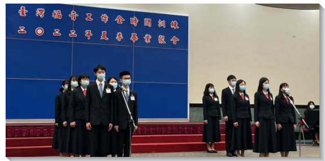
▲全時間訓練畢業學員於會中展覽見證

們每日的經歷，『望斷以及於獎賞』則是我們每日的目標。儘管有時我們會搖擺不定，看自己的情形或外面的環境而失去信心，但在訓練中我們有許多信心的見證人，還有同伴如同雲彩圍著我們，在這團體生活中，經歷基督身體上肢體間彼此的湧流供應。爭戰時，穿戴神全副的軍裝一同站立，拿起信心的盾牌抵擋仇敵一切火燒的箭。榮耀之神一次次的顯現和傳輸，也深深的得著我們的全心及全人，產生我們的奉獻，踏上信心的道路，築壇並住在帳棚裏，隨主出到全地，完全為神而活。抓住每一個今天，竭力拼上奔跑賽程，以基督為我們的獎賞，到主再來的那日，在國度裏與祂一同作王！