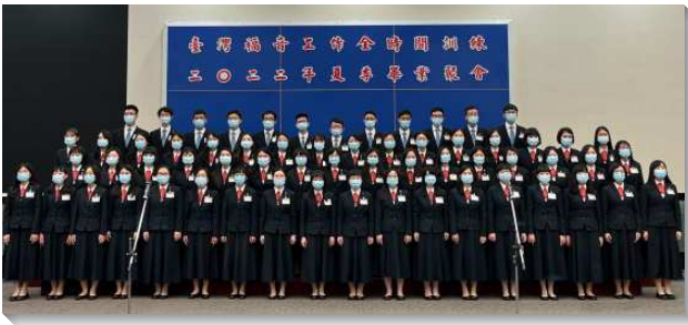
▲全時間訓練夏季畢業聚會在信基大樓舉行

在這兩年間，因國內疫情升溫及政府政策之規範，並為顧到每位學員的健康，能繼續有分訓練，大家歷經多次實體與線上的變動。在跟隨主的路上，我們受試驗，每一次的遷移，使我們再更新奉獻自己，也使我們經歷破碎，不再安逸、完整。一面，藉著主話的加力，使我們能過信心的生活，而隨祂前行，堅定不移。另一面，也藉著享受恩典之靈全備的供應，而超越各樣的限制，使恩典在我們身上繁增洋溢。我們向眾人宣告，不是我們能過這樣的生活，乃是因主自己在我們裏面活著，至終我們成了主恩典豐富的展示。