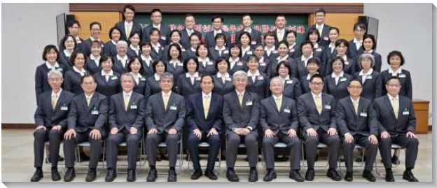
▲壯年班夏季畢業聚會於中部相調中心舉行

有姊妹見證，藉著享受基督得著新鮮的供應，服事喜樂洋溢。一位姊妹週週操練寫申言稿並實行申言，申言