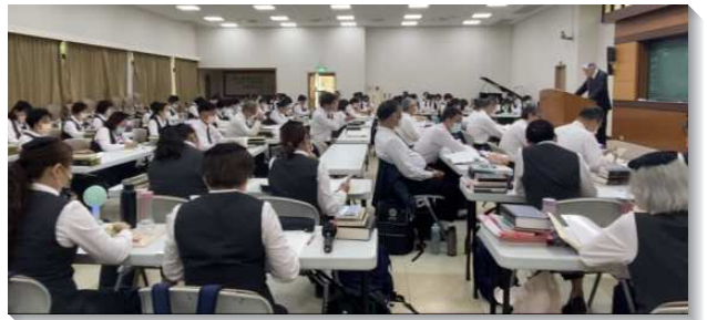
▲壯年班學員們多方裝備得成全

學員們見證結束，頒發畢業證書及各種獎項後，再有弟兄們的勸勉和祝福。學員能參加訓練，就是有分於神永遠的經綸，藉著各樣的恩賜者來成全我們，使學員成為盡功用的肢體，建造基督的身體。訓練會畢