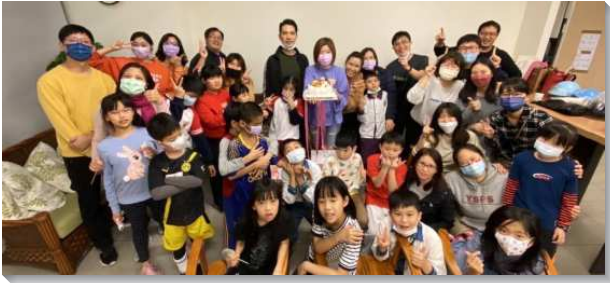
▲聖徒們同心經營兒童排

雖然實體福音行動受到限制，弟兄們卻不受大環境影響，放膽逆向思考，於端午連假時，研擬一場線上兒童排福音相調—搓愛玉活動，讓爸媽不必帶孩子出門，就