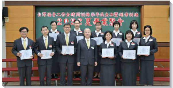
▲壯年班畢業學員獲頒畢業證書及各種獎項

在全體學員展覽第二首詩歌『讓我愛』之後，第二組畢業代表作見證。一位弟兄交通，他在核心課程中得著豐盛的供應，不僅自己得更新變化，連久不聚會的兒子也恢復召會生活。另位弟兄見證，訓練恢復他與主生機的聯結，並且幫助他操練靈、運用靈，為主說話。一位姊妹交通，她在核心課程『基督的身體』裏蒙光照，脫離單獨，投身身體生活。另一位姊妹交通，召會生活多年一直忙於服事，卻失去安息，但經過專項服事的操練，並藉著訓練而接受神聖分賜，使她重新恢復對主的愛。一位姊妹交通，在丈夫癌末，他們最後一次同唱詩時，她許下諾言，要加倍愛主，但幾年下來卻奔跑困倦，行走疲乏，但是感謝主，訓練使她再度得著加強，畢業後她奉獻自己，願意配搭移民開展。另一位姊妹交