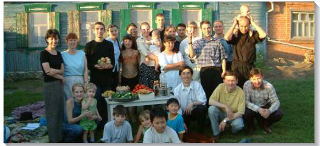
▲ 在羅斯托夫的聖徒們相調

在開展期間一些經歷：一、學習語言：一九九四至九七年我在聖彼得堡服事，隨時可以請到翻譯人員，以致沒有積極學習俄文。到 Pyatigorsk 以後，就沒有辦法隨時請人翻譯，聖徒們又非常渴慕交通，常常經過我家時，就進來與我們有交通，我聽不懂又不會講，只能比手畫腳，頓時覺得語言的重要。於是我和另一同工就找到一位很好的老師學習俄語，她是醫藥大學的語言老師（專門教從非洲來的學生）。經過密集的學習，半年後我就可以和聖徒們溝通了，這也是開展