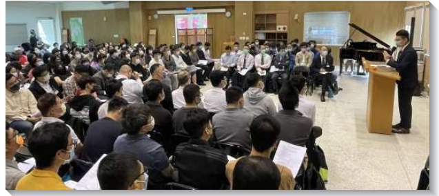
▲城中大同區聖徒們在聚會中聆聽信息

第二篇信息交通到在新路中的正常生活，乃是每早晨得復興，並天天得勝的生活。接續前一堂的奉獻，信息接續說到奉獻後該過的生活。從聖經的啟示看見神的話乃是神的呼出（提後三16），對於我們乃是要吸入。詩歌二百一十首說到這事，寫詩歌的人因著對主的經歷，副歌說，『我是呼出我的愁苦，呼出我罪污，我是吸入一直吸入，你所有豐富。』職事的話幫助青職聖徒看見，每早晨作任何事之先，若能給主十分鐘甚或更長時間，必從主得著復興。青職們要堅定持續操練神人生活，有一呼一吸的生活，不僅自己操練，也需要找到同伴、新人一同操練。同伴們彼此約