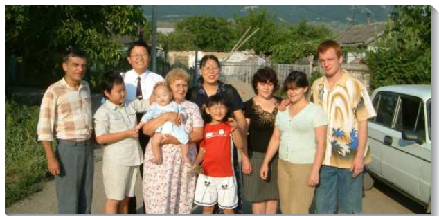
▲ 在 Pyatigorsk 的聖徒們看望牧養新人

三、在這區域的年輕人多，孩子多，而且孩子們都跟著父母過召會生活，暑假就參加特會、訓練，畢業後一個個都到莫斯科參加全時間訓練，日後我在國際華語特會、或是在安那翰夏季訓練看到他們，都非常得安慰，我們在主裏的勞苦，都不是徒然的。有一對中年的聖徒告訴我，他們全家都在參加莫斯科全時間訓練（他們有三個兒子），全家一同受成全，真是愛主，愛這分職事所釋放主的豐富，出代價受成全。