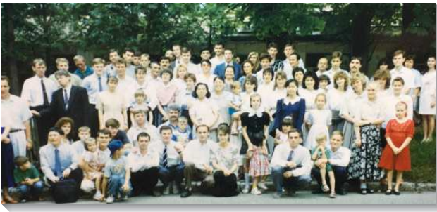
▲ 聖徒們參加在 Pyatigorsk 的夏季特會集訓

尋覓住所—開展的第一步，除了禱告之外，最重要的就是尋找住處，記得有一位俄國同工陪我搭四十八個小時的火車，從聖彼得堡出發到那個城市尋找住處。我們接待在當地一位尋求者的家，每天到市中心的公佈欄尋找貼出來的租屋訊息，撕了訊息就回到另一位弟兄的家打電話聯絡。當地的租屋的資訊極少，我們花了幾乎一個月的時間，才勉強找到一個公寓，地點和空間都合適，租下之後才知此屋曾發生兇案。感謝主！我們只管信靠神，繼續向前，主必保守。