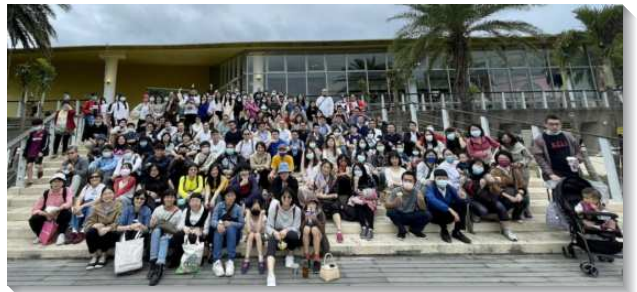
▲城中大同區青職聖徒至宜蘭相調

第三篇信息，說到李常受弟兄於『召會分項事奉的建立』一書中，所提及關於各界福音的負擔。藉由路加福音十九章十一至二十七節的比喻，弟兄姊妹看見，每個得救的人都需要去『作生意』。主將自己比喻為一個貴冑，往遠方去，將來要得國回來。他把僕人叫來，一人給了一錠銀子，這一錠銀子就是主的救恩。人人都得著了這救恩，保羅所得的是這救恩，弟兄姊妹也得著了這救恩。然而主的託付是吩咐他的僕人去生產，我們一旦得救了，就需要用這一錠銀子去賺得十錠，…至少賺得五錠。我們現今有這一錠銀子手中，將來如何，完全不是聽天由命，而是在於我們必須與主配合，接受負擔，傳揚福音。