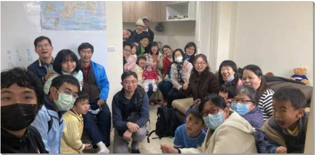
▲各地聖徒們配搭金門縣金沙鎮開展行動

金沙鎮開展始於二〇二〇年底，有一個全時間服事的家移民至此，並有全時間訓練學員來此五週開展。至今，每個月有台中市召會聖徒短期移民配搭（二週至四週時間），前後已超過七十位台中聖徒有分開展行動，加上金門眾召會聖徒相繼前來，以及從台島各處有四位聖徒移民至金沙鎮工作並居住此鎮，使得金沙鎮聚會人數從起初只有一位姊妹成長至目前光景：召會生活人數為三十人，主日聚會人數有七人，一個兒童排，家聚會人數為十五人，十七位新人得救。