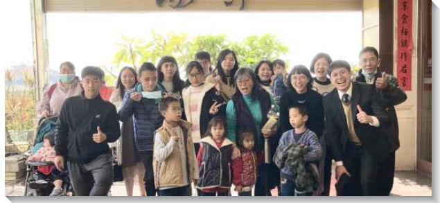
▲在金門縣金沙鎮的聖徒們相調

一位去年十一月得救的中壯姊妹，是土生土長的金門人，多年在金門的傳統影響下拜偶像，觀念根深蒂固，但主總是有奇妙的作為，經過週週牧養及認識清理舊生活的真理，主一直在她裏面引導。一次傳統祭拜日，她勝過了宗教的束縛和捆綁，並且再也不走回頭路，乃是把她生活的一切全然信託於主！眾聖徒也因而同享恩典。現在她遇到任何事能常常轉向主，向