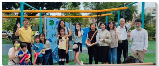
▲聖徒們喜樂配搭公園兒童福音

聖徒們已往在馬路上或一對一或二對一向路人傳福音或傳講人生的奧祕，現今主為我們再開啓另一條接觸人的路。兒童公園福音有別於馬路福音，聖徒們在公園中一同配搭兒童福音，有學生聖徒、青職配搭詩歌帶動唱，有聖徒配搭講故事，年長聖徒帶來小點心，人人都盡功用。孩童們常是真誠、單純、喜樂的