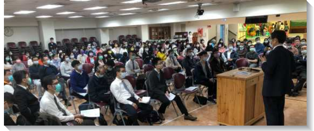
▲城中大同區兒童服事者及家長相調聚會

之後各會所有六組弟兄姊妹，見證她們如何照著這個藍圖來實行：有姊妹開拓者交通因著看見會所兒童生養眾多，就有負擔團聚幼兒的媽媽們，並且在服事幼兒排時，也牧養照顧孩童的媽媽們。有聖徒見證其兒女從幼