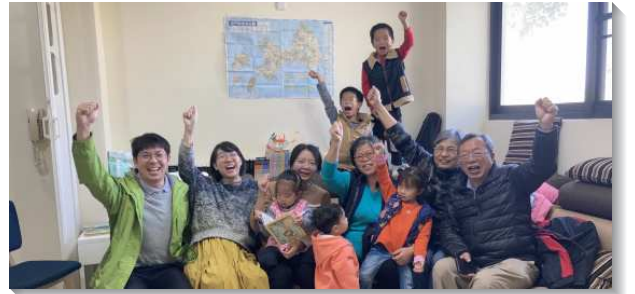
▲在金門縣金沙鎮的聖徒與得救的新人

另一面，在移民方面仍需要繼續加強。每一個移民的家庭（或聖徒）前來配搭，對金沙鎮都是莫大的幫助，將主對召會生活完全的恢復擴展到此。台中市召會和金門縣眾召會聖徒週週迫切為移民開展禱告並多方交通，開展至今，有四位聖徒移民前來金沙鎮居住、工作，這真是主奇妙的作為。