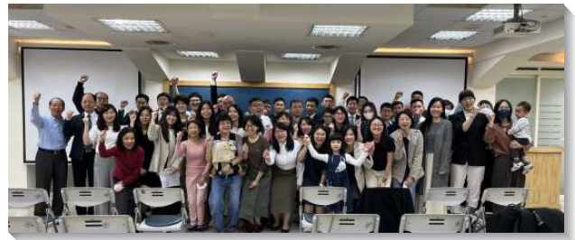
▲信基大區聖徒參加青職成全聚會

第二篇信息幫助青職聖徒看見，我們需要與同伴一同經歷在心思的靈裏得以更新，聚集成排，彼此相顧、激發愛心、勉勵行善，脫去以往的生活樣式，穿上實際的召會生活。第三篇信息說到，應當廢除尼哥拉黨的宗教