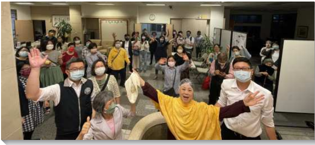
▲聖徒們傳福音帶新人受浸得救

各小區於年初訂定每週出訪時段及每月福音聚會的日期，在禱告聚會及主日聚會中繼續呼召聖徒有分。每週三、五晚上及六、日下午為各小區出訪時間，並且將出訪時所留下的名單在禱告聚會中彼此交通，為人代禱。除了邀約每月一次的福音聚會，也盼望眾聖