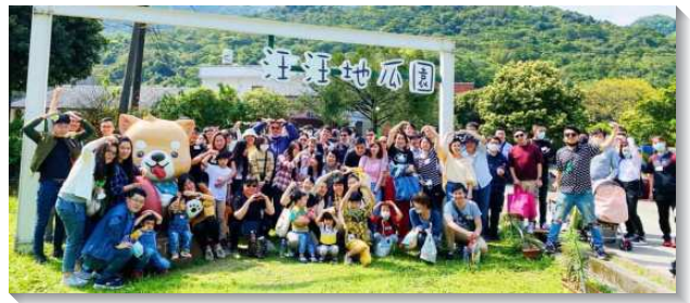
▲三個會所的聖徒們喜樂相調

四月份大安區的青職特會結束後，弟兄們再安排三個會所的青職聖徒有晚餐相調。因著之前多次的見面相調，彼此間不再生疏，用餐時氣氛很熱絡，互相問候與珍賞，小羊們也能自然的融入交通。藉著這幾次的相調，青職們在生活上聯結的更緊密，看到其他會所實行召會生活的衝擊力，青職們都羨慕能再突破及往前，也盼望能藉著相調帶進福音的行動。