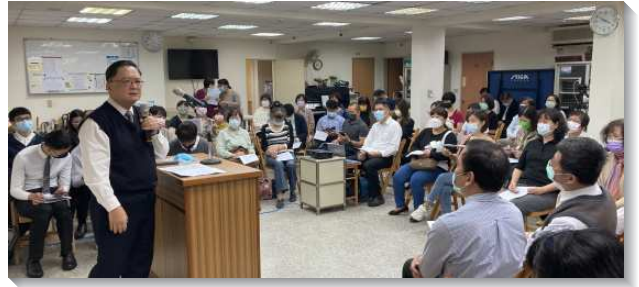
▲港湖區兒童服事者及家長事奉聚會

二、開拓者主動成全（相調）：姊妹們要主動彼此相調並成全人，列出名單來，有很多新手姊妹需要扶持，要幫助她們建立家庭祭壇，把家建立起來。家庭要健康，媽媽佔非常重要的地位，然而許多年輕的媽