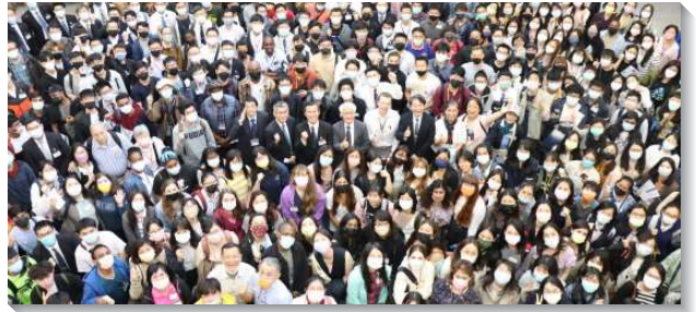
▲全台首次外語大學生相調聚會

在各地召會生活的展覽中，眾人看見身體的豐富，各校園都積極經營外語學生的福音工作。有些外語生見證，他們不僅接受福音，持續過召會生活，甚至開