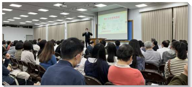
▲中學生服事者事奉相調聚會在三會所舉行

爲了得著青少年，今年召會藉著得榮基金會已過實施多年的『得榮青少年教育專案』，盼望擴大進入社區