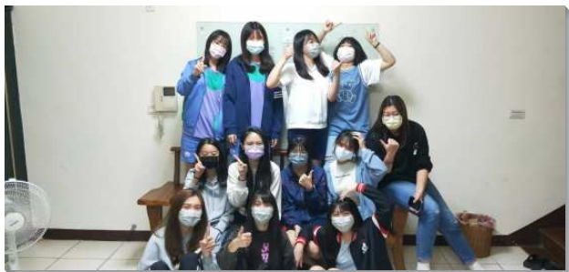
▲青少年聖徒邀約同學參加小排

五十六會所自去年底繁增出九十二會所後，原先屬本會所的學生們及服事者則歸回並重新成立學生區。父老們均非常關心青少年的屬靈成長，為使歸回的學生們與社區弟兄姊妹多有相調，經交通後，自去年九月開始，每週五晚間有青少年小排。由社區聖徒打開家提供青少年聚會場地，並由家長們輪流配搭作菜愛筵，讓學生們在一週繁忙的課業結束後，回到召