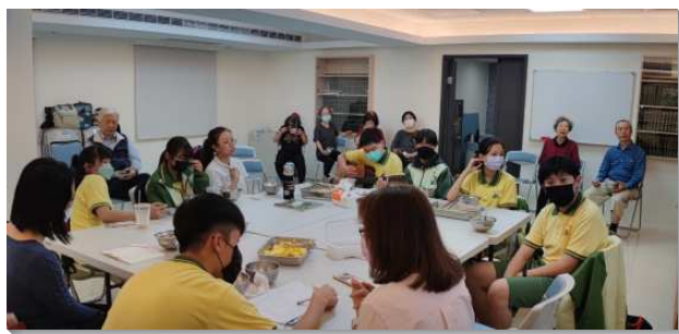
▲聖徒們一同配搭明德國中學生小排

每週除了教師、青少年服事者，也有各區聖徒同來配搭學生排。無論是豫備點心，聚會中分享，或是個別的關心學生，都是牧養這些學生非常寶貴的力量。藉著青少年排的服事，更多的聖徒都擺上他們的一分，人人盡功用，讚美主。（陳仁傑、許信得）