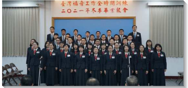
▲全時間訓練畢業學員展覽詩歌

學員分三個階段作他們的畢業見證。首先，在職事和真理方面，學員們見證藉著訓練，認識獨一的職事，就是向人供應基督，以建造祂的身體。爲此，他們願意緊緊跟隨職事的說話，並接受主在環境中的製作，以被新約的職事所構成。他們進入一年七次特會的說話、一九九四至九七年高峰真理、核心真理、聖經基本真理等，藉著研讀真理，被神經綸的異象所抓奪和定準，不僅自己得變化，也能爲著召會的建造，將真理說到人的裏面。