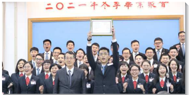
▲全時間訓練畢業學員獲頒畢業證書

第三，在事奉和心志方面，學員們憑著主恢復中能力的三個實質—禱告、那靈與話，執行神的行動，認定一生過福音與牧養的生活，並藉著活力排成全聖徒，作活而盡功用的肢體。事奉加強了學員們一生事奉主的心志，他們奉獻自己作召會中的得勝者，跟隨羔羊往全地去，在地上與神同情、同心並同工，忠信直至盡旅途。