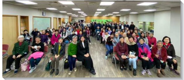
▲聖徒們參加週中成全一同蒙恩

第二個負擔，進入活力排的交通，使聖徒們看見，召會需要實行活力排以結常存的果子，這是我們的定命。我們必須享受基督而結果子討主的喜悅。我們這些葡萄樹的枝子，住在主裏面，接受修剪，使生命湧