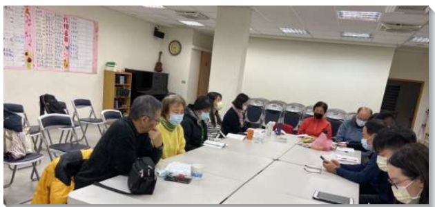
▲聖徒們有分守望禱告的生活

三、交通代禱拉近聖徒彼此的距離，並有了更甜美的福音、牧養、探訪配搭，及活力伴實行。四、爲福音朋友題名代禱，主吸引人向祂敞開、接受救恩，有多位已浸歸主。藉著定時禱告，我們得以更多親近主並事奉主，彼此相愛相顧。這是何等的恩典，願神繼續保守我們堅定持續有守望禱告的生活。（沈俊廷）