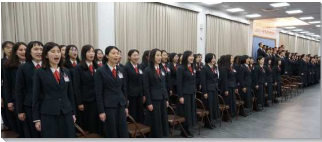
▲全時間訓練二〇二一年冬季畢業聚會

學員們再展覽畢業詩歌『起來，走生命窄路』。描繪學員們，在這兩年中跟隨主往前的經歷。當他們看見神的需要、聽見祂的呼召，就願意望斷屬地事物，起來投身主行列，接受屬天訓練。因著全球疫情影響，學員們經歷多次搬動，在未識的路上、變動的環境中，他們扎根在主裏，與良人有千百次親密、私下的交通，爲著祂