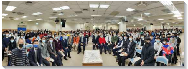
▲聖徒們歡慶第90至100會所成立

立事奉核心，藉著生活中的相調，調出一班年輕愛主的聖徒，樂意投入配搭事奉。往後幾年間，為了成全有心事奉主的聖徒，陸續開始實行『區負責成全』、『在職成全』、『姊妹成全』等訓練性質的聚會，至今。聖徒們也一同過神人生活，普遍實行晨興、禱告、相調，並進入高峰的真理。聖徒高昂的士氣與福音的衝擊力，產生出『聖徒能認同、新人樂留下、浪子願回家』的蒙恩，人數大量繁增。此時，由於會所場地漸不敷使用，眾聖徒操練將家打開，成為主日擘餅聚會的場所，這樣的實行，帶進極大的祝福。同時，十三會所也大量實行活力排與兒童排，一家一家同過召會生活。在一九九六年，亦建立青少年與大專專區，著重培育屬靈的後代。