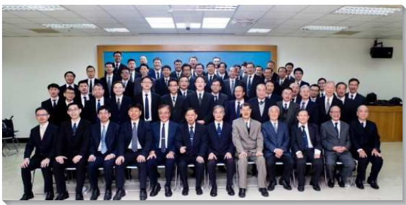
▲第90至100會所於2021年11月14日成立

在主的保守下，政府於十一月初進一步放寬集會人數的限制，因此我們得以舉行大型的實體聚會，讓更多聖徒同聚一堂，一起見證主在這地所賜下的繁增之福。本次大會，分別於羅斯福路六段、興隆路三段、景美街等六個會場進行實體聚會，並透過網路同步連線，當天共計有將近三千八百位聖徒來到現場聚會。