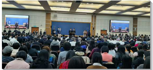
▲ 聖徒們踴躍上台分享信息之豐富

與神聖三一同活就是與基督這以馬內利同活，並有復活的基督活在我們裏面。我們要與基督這以馬內利同活，就需要在祂神聖的同在裏。復活的意思是：一切都是出於神，不是出於我們；只有神能，我們不能；一切都是神作的，不是我們作的。第五篇說到與神聖三一同活，與經歷神在我們裏面運行有關（腓二13）。我們需要看見，神在我們裏面的運行是一件神奇的平常事；從外面看沒有什麼奇特，但按屬靈的意義看卻是重大的事。並且神的運行是帶著『耶穌基督之靈全備的供應』（腓一19），使我們能應付各種環境，而經歷基督，享受基督，活基督，並顯大基督。