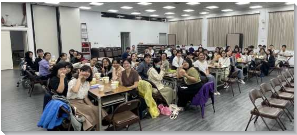
▲師大期初福音在三會所舉行

弟兄們鼓勵服事者，要維持學生們有活力，並要把全力放在焦點上。服事者利用晨興、晚禱，分享開展的見證，以彼此激勵、代禱，藉此加強、幫助學生們。另一方面，我們也一同為其他的校園禱告，打團體的仗。啓示錄六章二節說『我就觀看，看哪，有一匹白馬，騎在馬上的拿著弓，並有冠冕賜給他，他便出去，勝了又要勝。』我們經歷了福音無論傳到那裏，都征服並勝過各樣的環境。以下是各大區的蒙恩見證：