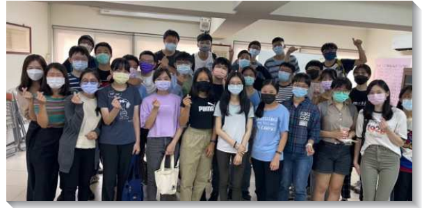
▲北醫學生於福音節期配搭傳福音

士林區：此次期初福音節期，共有十四位受浸得救。學期開始前，學生與聖徒一同為著校園守望禱告，眾人為著校園福音同心合意、靈裏火熱。此外，學生每週至少有三次活力排交通禱告，一面彼此代禱，一面也為福