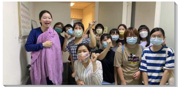
▲大學生在期初福音中受浸

福音我們乃是先享受主的愛、被主充滿，就不在於外面拿了多少名單、帶了幾個人得救，而在於我們裏面是否被主得著。這次文山一大區有兩所大學的學生、學員和服事者們一起配搭，經歷在身體裏爭戰並互相扶持。因著有從主來之基督身體的感覺，知道主在這次的開展中給我們屬靈的託付，開展就不會是一種行動的壓力。我們不只是配搭，更是在主裏調為一。當我們享受身體裏的調和，配搭也非常喜樂，自然而然帶下神的祝福。