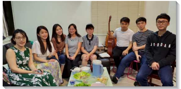
▲青職聖徒一同聚集受成全

藉著台北市的青職特會，青職們又更往前了，有本來不敢傳福音的，開始有分馬路福音，發福音單張。也有的開始對自己身旁的朋友有負擔，邀約室友參加愛筵，並為他們的得救迫切禱告。另有的開始對其他青職的聖徒有負擔，顧到外圍的弟兄姊妹，與聖徒配