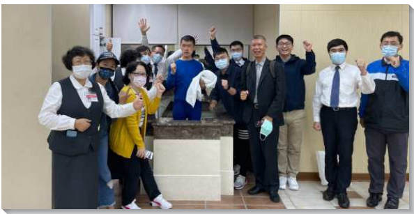
▲學員和聖徒們在台北六會所為新人施浸

壯年成全班學員一百一十九位，於十月二十六至三十一日，編組成二十二個開展隊，前往台島及澎湖馬公各地，展開一週福音行動。本次開展包括台北市召會（六、四十一會所）、桃園市召會（五/二十二、十一/十三、四/十九會所）、新竹市召會（第六大組）、苗栗縣（通霄鎮）、台中市召會（北屯）、彰化縣（和美鎮、員林市召會）、南投縣（埔里鎮召會、鹿谷鄉召會）、雲林縣（崙背鄉、荖桐鄉召會/二崙）、嘉義市召會（梅山）、台南市召會（新營）、高雄市召會（五甲、明誠）、屏東縣（枋寮鄉、佳冬鄉）、花蓮市召會、台東市召會、馬公市召會。各隊開展總時數為六百四十六小時，各地配搭聖徒共四千六百五十七人次，福音記名一千七百五十七人，受浸一百二十六人。