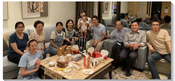
▲聖徒們彼此關切人人入排

藉著弟兄們的幫助，各區各排從禱告開始，有負擔的弟兄姊妹生機的形成幾個禱告團，開始為著原有各排的聖徒們有禱告。同時也開始重新整理名單，為著區裏每一位聖徒都能入排有許多的代禱、交通、餵養