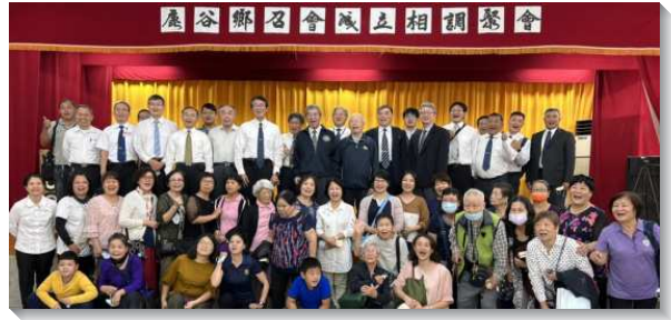
▲聖徒們參加鹿谷鄉召會成立聚會

桃竹苗區共五隊，一週得著三十一位新人。桃園市的三隊，大都進入社區，進行屬靈的戶口普查，雖然常遭冷漠的拒絕，難以得到一個記名名單，但是學員和聖徒們不懈怠，憑信心往前。苗栗縣通霄鎮隊，在廣闊的鄉野村里叩訪，藉著同心合意和迫切的心，在這偶像之地得著五個新人。值得一提的是，在桃園十一/十三會所隊，促成一對失和又失聯的母女重新和