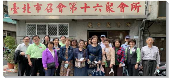
▲聖徒們出外訪人傳福音

為此，聖徒們興起活力小組的禱告，產生負擔後列出三位福音朋友的名單，為他們提名代禱，進而發送福音材料，邀約線上福音家聚會或線上福音聚會，藉著同心合意與殷多的禱告，祈求莊稼的主收割祂的莊稼。有位青職姊妹的父親，曾在疫情前參加實體福音聚會，並表示下次來台北看望女兒時願意受浸，然而因疫情爆發，諸多限制使姊妹的父親受浸時間耽延。藉弟兄們的帶領，區裏的聖徒拿起負擔，各活力組實行透徹的禱告和交通，為其父親的得救鋪路；另一面也在線上加強牧養。區裏聖徒們迫切的傳輸：一人得