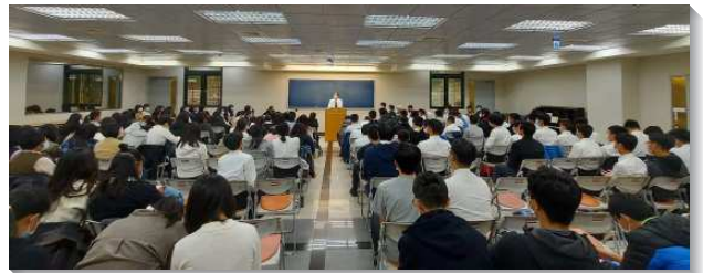
▲北投大區青少年參加特會

信息中看見，妓女喇合因著對神的眼光與見識改變了她的命運，她公開的掛出紅繩，也激勵弟兄姊妹們要剛強放膽在校園中見證神的救恩。許多即將升高一的弟兄姊妹也宣告，願意在新學期的開始，在新的校