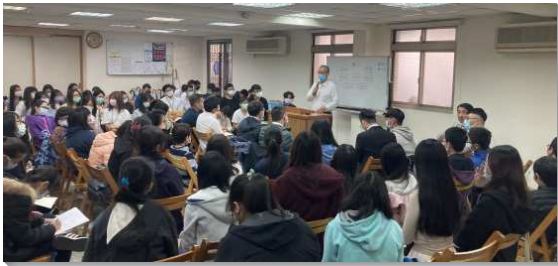
▲港湖大區青少年及大專特會

此次特會主題為『在約書亞記、士師記、路得記中的聖經榜樣與鑑戒』。從約書亞、底波拉、基甸、參孫、波阿斯與路得等人物看見其榜樣及鑑戒。為加強學生，特會前一週我們召開豫備聚會，邀請服事者與家長有