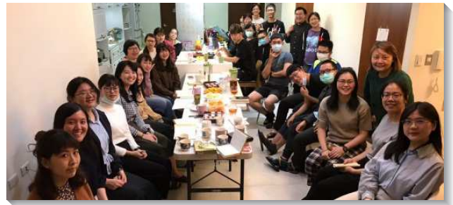
▲青職聖徒一同在小排中享受主的牧養

在青職方面，本會所自二年前開始申請全時間學員來開展，並將社區弟兄姊妹編組成軍，同心配搭傳福音，邀約人進入青職排。福音朋友藉著愛筵得著人性的顧惜，並喫喝神的話，而有神性的餵養，加上弟兄