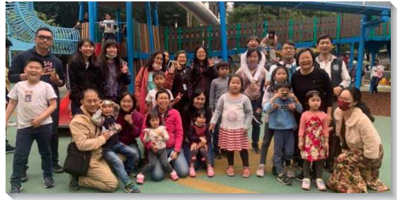
▲聖徒們在公園進行兒童公園福音活動

會所於週五也有為著幼小孩童的幼幼排。下午五時半，姊妹們就會準備晚餐，讓青職的聖徒們帶小朋友一起享用，會後一起唱詩歌及讀福音故事。藉著人性的顧惜，與神性的餵養，讓家長們感到貼心，更讓孩子們感受到愛。從起初只有兩位孩童參與，慢慢帶進其他的家庭同來配搭。我們看見影響孩童最深遠的就是父母和家庭，因此從公園福音到幼幼排，弟兄姊妹不分年齡，社區、大專、學員們都同心配搭，竭力傳揚兒童福音，接觸兒童及家長，得著召會下一代！求主繼續祝福兒童，恩上加恩，力上加力！（黃芷琳）