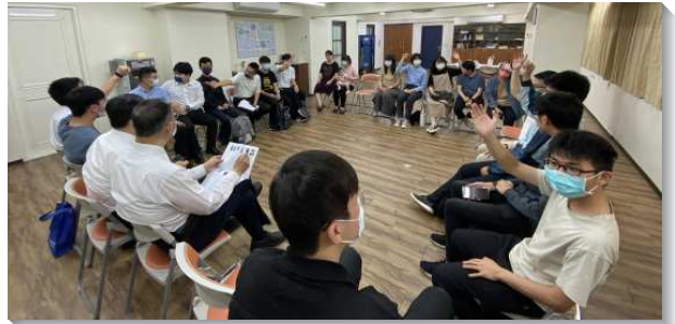
▲ 大學生與服事者交通問答

另外，週六晚上安排一場線上福音聚會，邀請在台大解剖研究所任職的教授弟兄，以解剖學的角度帶進福音。我們深覺線上福音是得人的好憑藉，因此，鼓勵學生們廣邀同學、朋友上線參加。最後，總共有二