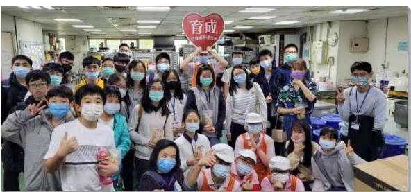
▲ 信基區青少年特會行動

值得一題的是，這次聚會開頭都先由高中弟兄釋放信息，姊妹作見證，他們有的曾參加過一週成全，或