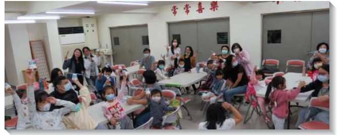
▲聖徒們多元多方堅定持續服事兒童排

弟兄姊妹們以禱告開始，堅定持續的帶著兒女每日為同學提名代禱，並且製作邀請卡週週在學校發送。未料，許多在禱告中提名的同學都不能來，於是聖徒們就積極帶著孩子到公園接觸人。一次在公園裏，遇到孩子