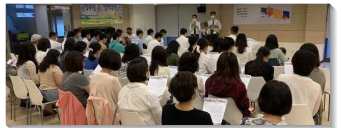
▲聖徒們爭戰禱告經歷主的得勝

高波時紛紛確診，且部分親人屬於重症。藉著聖徒們每日、隨時的為他們禱告，姊妹的親人逐一康復出院，堅定了姊妹對主的信心，更寶貴的是姊妹在靈中真實遇見主，並宣告要將自己的家交在主的手中。