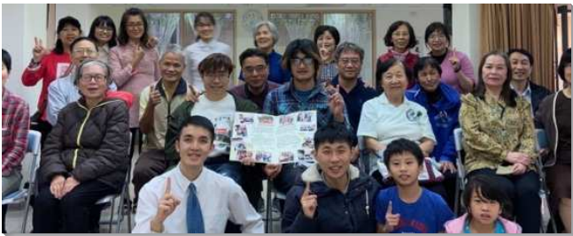
▲八十五會所於二〇二一年七月四日成立

但轄區內偶像廟宇林立，何等需要主的見證！原本萬華區只有二會所及十八會所，在二〇一三年增出五十會所，二〇一七年增出六十四會所。接著從二〇二〇年起，也計畫在青年公園週邊社區再成立新的會所。