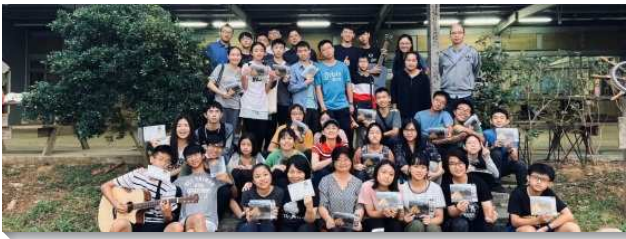
▲士林區青少年戶外相調

特會總題為約書亞記、士師記和路得記中的人物榜樣，包括迦勒、基甸、約書亞、參孫、路得及波阿斯等，帶青少年進入聖經人物的特點。其中，除了參孫的事例有我們需要受警惕的地方，其他人物皆有積極的特