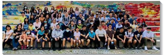
▲大安區青少年喜樂相調

第三篇提到基甸和參孫，我們需要藉著他們失敗的事例受警惕，不愛世界，不放縱肉體情慾。逃避青年人的私慾，保守自己的靈、魂、體不被世界玷汙，在服裝、