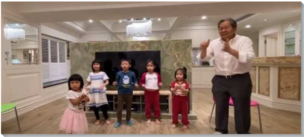
▲聖徒們家打開配搭兒童排

一對年長夫婦接受負擔願意為自己的孫女打開家。聖徒們齊心扶持，不僅有媽媽們帶著自己的孩子配搭，也有年輕的青職夫婦帶著自製的點心前來。會中