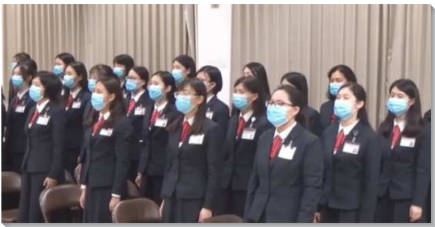
▲全時間訓練中心呼召聚會以直播方式舉行

本次呼召聚會的主題為『寧捨浮華世界，贏得榮耀基督』。傳道書三章十一節告訴我們：『神造萬物，各按其時成為美好，又將永遠安置在世人心裏。』神所造的一切是為著給人享受，但當人嘗過浮華世界的享樂後，仍會感到虛空，因為世上一切事物都是短暫且稍縱即逝，所以我們能領悟，人們都會渴望存到永遠的事物；這永遠就是歷世歷代以來，神栽種在人裏面，一種要有目的的感覺，而全宇宙間，惟有永遠的神—基督自己，能真正滿足這樣的需要。