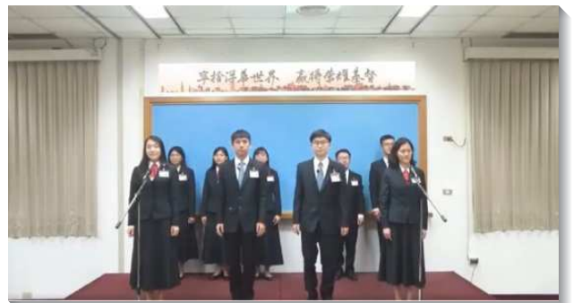
▲訓練學員分享參訓蒙恩

訓練幫助學員們看見神的經綸，就是要將祂自己分賜到祂的選民裏面，這翻轉我們的事奉，不再只是作外面的事工，更是要將基督分賜到人裏面。我們也看見天然的事奉和啟示的事奉不同，惟有得著神聖內在的啟示，我們的事奉才有活力。藉著啟示，我們的心志就得加強，使我們奉獻一生都要走神命定之路，為著職事的工作，為著建造基督的身體。