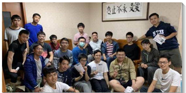
▲大學生在弟兄之家打開家傳福音

願主繼續祝福台大、台科大這兩所校園，藉著福音與牧養得著更多的青年人。 (邱宇光、梁黎云)