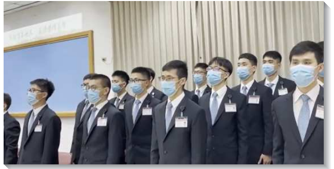
▲訓練學員唱詩展覽

接著學員分享他們蒙召參加訓練的見證，以及在訓練中所受各方面成全的蒙恩。有弟兄自問，他既願意受六年的訓練，為著成為一名工程師，為何不願意花費一到兩年，受主訓練，為著作主合用的器皿？另有姊妹見證，自己若羨慕在世人眼中不同凡響，恐怕在神眼中的價值就極其有限，但神榮耀的經綸和祂自己將她奪取，她就甘心成為被擺在壇上獻給神的燔祭，