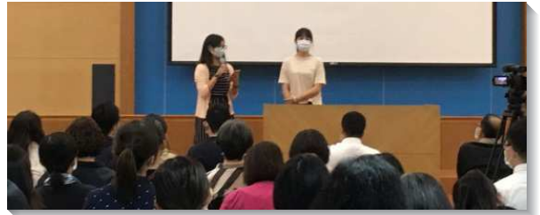
▲聖徒見證關於兒童服事的蒙恩

綜觀這次事奉相調與研討，方向清楚，負擔明確，見證分享及分組問答更在實作上提供許多寶貴的經歷，使與會者受惠良多。願主祝福聖徒們同心合意，堅定持續實踐『兒童是個大的福音』。讚美主！（黃惠瑜）