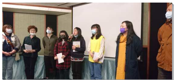
▲聖徒們為福音開展樂意受成全

神是牧養我們直到今日的神，因此線上福音、禱告、牧養、主日聚集的人數不應該受疫情影響而減少。雖然景美捷運站二號出口、景行圖書館、及世新大學附近都不能如之前實地去傳福音，但福音卻藉著網際網絡走得更遠、更大、更廣。只要我們善用電子福音材料並多面多方多時的禱告，更加緊密參與從中心到圓周的聚集，主必定會將得救的人數加給祂的召會。（周子敬）