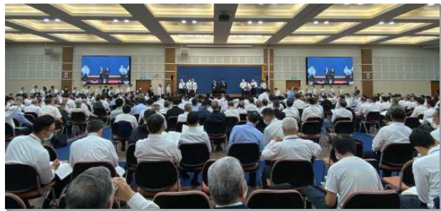
▲弟兄們踴躍分享，回應主的說話

此外，在三個梯次集調中也各安排兩場專題交通，分別是關於『全台眾召會鄉鎮移民開展』，以及『建立福家架構，養成生養習慣』。關於移民開展，弟兄們交通到基督徒該移動，因為神要在人的行動裏行動。如果人一直駐留不動，神的行動就會受到限制。自去年六月至今年五月，全台眾召會同心合意配搭，已成立八處召會，分別為：屏東新園鄉、里港鄉、高樹鄉，嘉義布袋鄉、溪口鄉，彰化溪洲鄉，金門金城鎮和金寧鄉。同心合意是開啟新約中一切福分的萬能鑰匙，我們藉著有分於基督天上的職事，餵養祂的小羊並牧養祂的羊，以照顧神的羊群，就是召會，結果帶進基督的身體，就能進入一個新的復興。