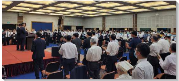
▲與會聖徒們藉著唱詩歌挑旺靈

第五，在召會裏真正的同心合意，乃是實行基督身體的一，就是那靈的一。我們要領受神的祝福就必須實行一，而實行一的路乃是憑著同心合意。第六，為著我們生命的長大，並事奉上的用處，我們必須對付天然的個性。那靈藉著複合之靈裏十字架殺死的元素，藉著那靈的管治，藉著作為那靈之基督的光照，並藉著召會生活、結果子和餵養小羊，對付我們天然的個性。第七，神經綸的高峰乃是基督身體的實際，而相調的目的是要將我們眾人引進基督身體的實際，我們需要在作為手續的眾地方召會裏，好被帶進基督身體的實際這目標裏。未了，得勝者由得勝的基督作為七倍加強的靈所產生，他們有負擔要建造基督的身