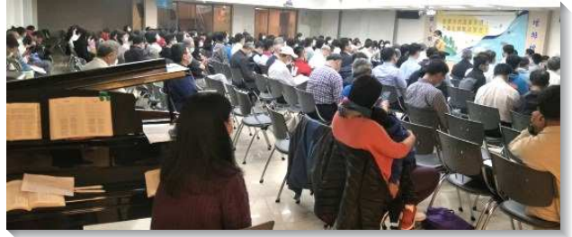
▲聖徒們參加親子生活見證聚會

許多家長分享，因為親子共同操練背經、唱詩與禱告，而有一同經歷主的機會。孩子在生活中出錯或失誤的小插曲，沒有演變成責備或爭執的場面，反而因父母