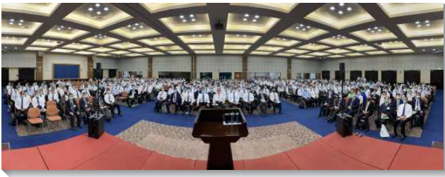
▲聖徒們參加第一梯次全台弟兄事奉集調

本次訓練共有八篇信息，分別為八個重要的因素。首先，我們要看見神聖啟示的最高峰—神永遠經綸的啟示，要過神人的生活，並接受有關牧養的負擔，並以禱告、實行、堅定持續的方式，與主合作，帶進新的復興，以終結這個世代。第二，我們需要藉著時代的職事，得著時代完整的異象（就是構上時代，承繼一切的異象），並緊緊跟隨，而活出並作出新耶路撒冷。第三，我們要看見召會是在三一神裏，而地方召會乃是基督的身體在某一地方的顯出。我們要有身體的生活，就必須滿有對身體的感覺，以頭的感覺為自己的感覺。我們無論作甚麼，都必須正確的考慮到身體。第四，我們惟有服從基督獨一的元首權柄，纔能真實的實行召會生活。今天在召會生活裏有神聖的管理，這管理來自神和羔羊的寶座。神從這寶座分賜生命、帶來恩典，並帶進交通。