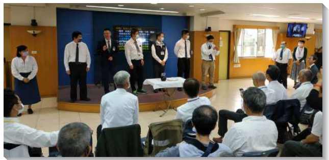
▲ 全台聽障手語聖徒一同參加主日學餅

在牧養上，愛有效能。若非神愛世人，我們就不會得救。若非我們真實的愛罪人，就無法合式且持久的帶罪人得救。若非我們真實的愛聖徒，就無法堅定持續的在生命裏彼此牧養，或牧養新人和久未聚會的聖徒。這也是主對所有愛祂之人的囑咐：『你餵養我的小羊』、『你牧養我的羊』、『你餵養我的羊』。