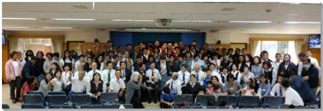
▲ 全台聽障手語特會於台中市召會復興大樓舉行

去年因為疫情緣故，手語特會在台南裕忠會所舉行，只有鄰近地區少數聖徒聚集，並以視訊方式讓全台聽障聖徒參與。今年雖仍有疫情，卻在多方必要措施豫備齊全，和主的保守下，使全台的聽障聖徒得以相調在身體的水流和主的說話裏，眾人都滿了感謝。