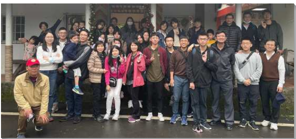
▲ 聖徒陪同青少年一同戶外相調

六十五會所為了幫助青少年養成正常喫喝享受主的生活，於三年前我們鼓勵青少年先從一週兩次的晚禱生活開始操練，循序漸進的再加上一週至少兩次晨興的操練。每早晨有家長、服事者或大學生一對一陪同青少年過晨興的生活。因著經歷享受主的喜樂，有的青少年甚至願意一週四、五次的晨興操練；晚上則為二至四人的分組晚禱，使同伴間彼此有交通，也能一起為福音朋友、為同伴、為青少年的行動禱告。