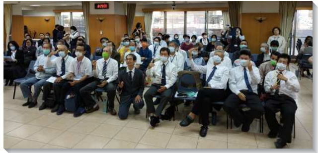
▲ 全台聽障手語聖徒享受信息交通

三篇信息和弟兄們所交通的負擔，盼望聽障的聖徒們，首先要看見，今天全台眾召會一直都在實行神命定之路，這不該是只有聽人聖徒該有的實行，而是全體聖徒都該走上去並成為習慣的事奉之路。藉著忠信