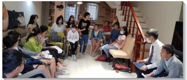
▲ 聖徒一同配搭兒童救恩班

兒童專項是一項長期的服事，感謝主和忠信的聖徒抓住機會，為主擺上，在異象裏憑愛服事，帶下了主的祝福。我們繼續仰望主，使我們靠著聖靈的能力，充盈滿溢的有盼望（羅十五13）。 （王仁越）