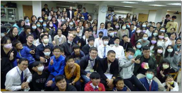
▲港湖大區青少年寒假特會

摸著的也可以侃侃而談，更有六位福音朋友因著特會的話語受浸得救。我們深覺，那靈向眾召會所說的話，不分年紀、蒙恩先後，凡有耳的都應當聽。願主的說話加強我們，成為對祂有時代價值的青年人。（賴中仁）