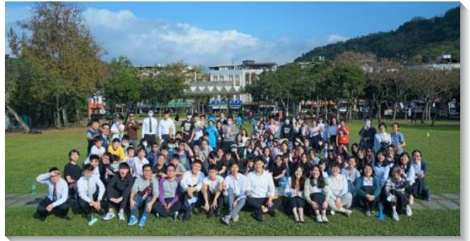
▲文山一大區的青少年寒假特會

文山一大區 青少年寒假特會於一月二十三日至二十四日在十三會所舉行。共計九十二位學生，十三位大專生