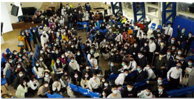
▲城中、大同及士林區的青少年寒假特會

信基大區 的青少年寒假特會於一月二十一日至二十三日在三會所舉行，共有五十二位青少年和二十三位服事者參加。這次特會的主題是『包羅萬有的基督』，盼望學生們認識包羅萬有、延展無限的基督乃是新人惟一的構成成分，因而操練過新人的生活。為幫助學生認識並過新人的生活，各會所、各年級之間先要失去區別而相調在一起。青少年們還要操練天天晨興，因復活生命的新鮮供應日日得更新，並且在日常生活中照著那在耶穌身上是實際者學基督，過團體的神人生活。