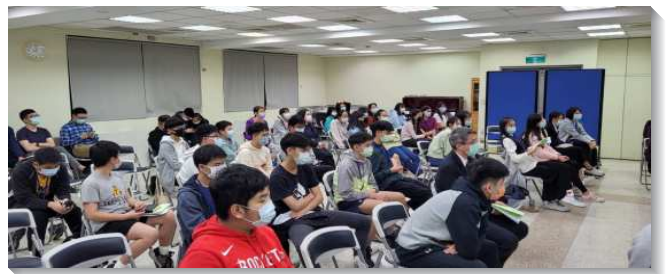
▲信基大區的青少年寒假特會

特會末了，青少年們上台奉獻並宣告：要將自己的心全然的奉獻給主，脫去一切屬地的享樂與愛好，奉獻向同學傳揚福音、奉獻過個人禱告的生活。（劉珈泓）