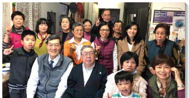
▲聖徒們一同配搭主日開家

二月二十一日主日，本會所有一個小區成功實行了『主日分排擊餅』，許多福音朋友受邀前來，使聖徒們士氣大振。未來將繼續鼓勵更多聖徒把家打開，早日落實『挨家挨戶』歡躍擊餅的光景，帶進召會的繁殖與擴增，願我們都在主的行動中行動而蒙福。（葉增勇）