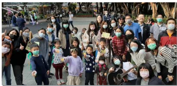
▲聖徒們在公園一同配搭兒童福音

今年上半年，各區聖徒陸續邀請所接觸的兒童家長們，參加主日聚會或是主日中午在會所的兒童排，使這些兒童家長們逐漸被牧養並穩固，好將他們帶進召會生活中。願主繼續祝福，藉著兒童公園福音，得著兒童與家長們，帶進召會的繁殖與擴增！（林蔚穎）