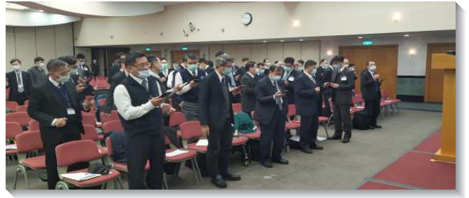
▲全台同工成全訓練台北場於信基大樓舉行

督，在新造裏彰顯神，並將神分賜給別人。主來不是召義人，乃是召罪人，這是祂的心。因此，我們需要照著主的心，並在基督不變的愛裏來牧養人，也需要看見這愛是有效能的。知識是叫人自高自大，惟有愛建造人。我們彼此相待，當以謙卑束腰，在愛中彼此洗腳，學習在主面前供應人，同時也願意從別人身上得著供應。