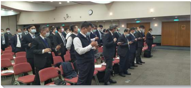
▲全台同工成全訓練分八個場地舉行

成全訓練共有六篇信息。第一篇信息為『改制需要我們有異象，並忠於我們所看見的異象』。改制是要把我們恢復到聖經的啟示，我們在各地作工總要把異象擺在前面，走合乎聖經的聚會與事奉之路。五旬節後，初期召會的聖徒乃是挨家挨戶的過活力排的生活，主今日恢復中召會的工作，乃是藉著聖徒在活力排中實行生、養、教（成全）、建（藉禱、研、背、講帶進申言），使神所要得著基督的身體一產生並建造起來。