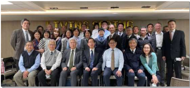
▲八十三會所成立於二〇二一年一月三日

當天的聚會，首先是可愛的兒童展覽，看見召會下一代的盼望。接著有三組社區聖徒作見證，聖徒見證家中孩子幼齡時因兒童排蒙恩，如今孩子雖已長大，仍繼續家打開作兒童排，藉此傳輸以兒童排雙向得人的負擔。