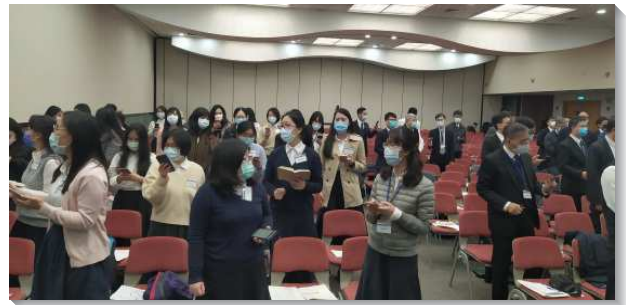
▲台北場聖徒於會中唱詩歌挑旺靈

第五篇信息『為著召會的擴增和開展如何成全人並帶出人來』。以弗所書四章的恩賜者，乃是為成全聖徒，為著職事的工作，為著建造基督的身體。主今天恢復的目標，就是恢復所有信徒都能供應基督，使召會得以建造起來。召會不能擴展的原因，在於我們不能成全和帶出人來。無論是召會或是專項服事，首先必須建立核心，以活力排的方式來成全人。一旦形成核心，我們首要注意的是禱告。藉著禱告，將人帶進核心裏。我們一定要抓住機會，把一切擺上，產生人，使主得榮耀。