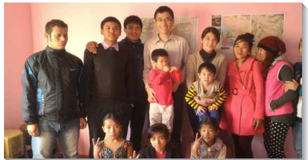
▲聖徒們訪問波卡拉

二〇一五年九月新憲法通過，確立尼泊爾是宗教自由的國家，使得傳福音不受攔阻。但也因政治與種族的問題，與印度的邊境關閉了八至九個月，物資十分缺乏。當時缺水、電、瓦斯、汽油、食物。首都的路上只有極少的車子在跑，一天停電十四個小時，一週只有半個水桶的水可以洗澡，也需買木柴來燒飯。雖然外面環境極受限制，但福音的大能卻更得勝。這一年有從印度、台灣、韓國、日本、香港來的聖徒們一同配搭開展，一整年帶了超過一百五十位尼泊爾人受浸得救。當時我們天天在路上邀請人回住處陪談，青年人都非常敞開，許多人不只願意開口禱告，更願意受浸得救。有一日從早到晚，就受浸了十二位。