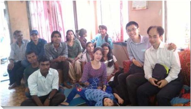
▲聖徒們至新人家看望

——〇一二年至二〇一四年期間，我因著在台北三會所——訓練中心服事，所以有機會跟著學員到日本及泰國開展，經歷了——不是我能作什麼，而是基督在尋求擴展；祂需要無用的荆棘，使祂能在其上焚燒。於是興起了海外開展負擔，之後就與姊妹帶著三歲跟一歲的孩子，於二〇一四年七月到了印度的新德里。前半年的時間都在適應印度的環境，語言、文化、氣候、飲食、召會生活，每一項都是大挑戰，也因水土不服而多次生病。期間更因語言的限制，多次興起想要回台灣的念頭。但是感謝主，藉著祂的恩典，與許多台灣及印度聖徒的扶持，使我們一家能漸漸盡上功用。