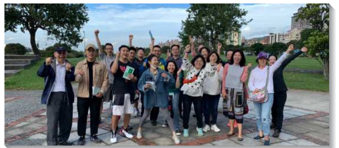
▲聖徒們週六早晨到戶外操練靈

感謝主的憐憫使我們不受打岔，週週持續操練至今將近一年。每週藉著呼求主名，我們享受聖靈的澆灌，呼求中，常常喜樂的眼淚就不自覺的流下來。讓