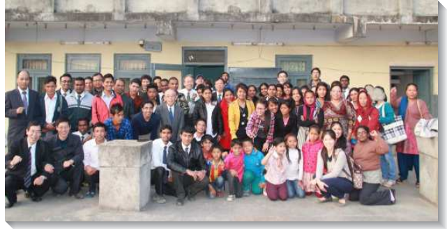
▲二〇一五年聖徒們參加全國特會

當地弟兄的陪同下，三週內豫備好訓練中心及所需的設備，於八月中我們家與印度全時間訓練的第二年學員，陸續抵達尼泊爾。在尼泊爾的頭一年，我們都經歷了林後四章十六節所說，『所以我們不喪膽，反而我們外面的人雖然在毀壞，我們裏面的人卻日日在更新』。