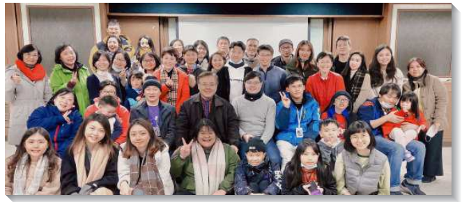
▲聖徒們齊心得人開家增排增區

去年暑假，大專區因著展望交通的傳輸，學生們對福音及增區滿有負擔，八月時正式增出四個排的架構，並於每週主日分四個地點實行主日聚會。其中的大專三排以姊妹為主，當時人數只有七位，更憑信宣告要在年底增出新的大專區。我們能見證神的公義與信實，當祭司把腳掌踏在約但河裏，河水便分開立起成壘，以色列國民盡都過河。當我們向著神認真奉獻時，主就作新事，當月就有一位弟兄得救，並且一連結了好幾個果子。