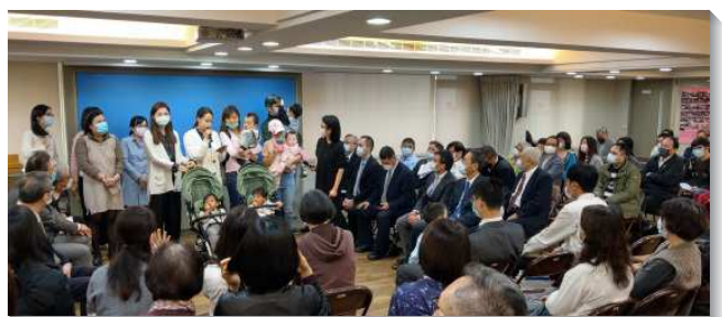
▲新開兒童排的家在聚會分享蒙恩見證

聖徒們見證開家有許多蒙恩：服事兒童排能讓未得救的家人有機會接觸福音。藉兒童排可邀請親友或同學，孩子們都很期待兒童排，也有負擔邀約同學到家中來。開家使親子學習在生命裏服事人，並與肢體有更多配搭（帶詩歌、彈琴、說故事、講見證），因而將喜樂的召會生活帶到家裏來。讚美主！（賴燕慈）