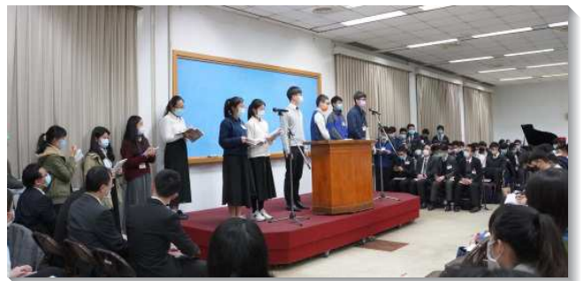
▲大學聖徒在冬季現場訓練中踴躍分享

這次的訓練，每天皆有清晨及午間系列，藉著服事者一步一步帶領學生唱詩、禱讀、禱告，使眾人每天的新起頭都有好的開始，抓住享受主的祕訣，彼此挑旺、焚燒。不僅如此，大學生們皆相當認真進入訓練的每一項操練，聽信息及禱研背講中積極作筆記、踴躍上台分享，抓緊零碎時間與同伴禱背經節，藉著默經考試更多被真理構成。這次訓練中，學生主動上台應考，其中一篇信息生機指派大一、大二的弟兄姊妹上台考試，雖然大多數的學生是第一次參加結晶讀經訓練，但是他們的單純、剛強、在身體裏彼此堆加，使眾人同得激勵，也同享基督的豐富。