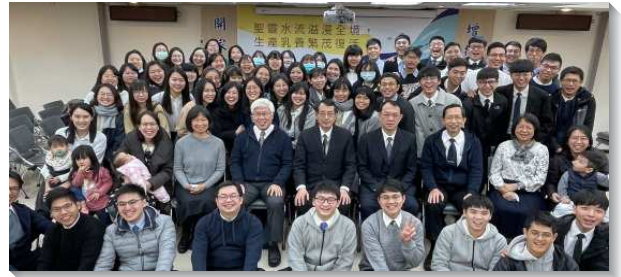
▲八十一會所於二〇二一年一月一日成立

弟兄們期盼本會所能成為北投大區的苗圃，負有培植人才、產生人才、輸出人才的使命。因此，傳福音得人是未來努力的重點項目，本會所設定了每年百分之二十五的成長率，希望藉此鞭策自己不要怠惰，要翻轉整個學生區的風氣。同時，期待未來能產生人才、輸出人才，分送到各會所，因此設定每年要送出百分之十的青職聖徒到北投大區各會所，成為各會所的主戰力。