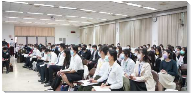
▲大學聖徒專注進入冬季現場訓練信息

第十篇說到，我們過敬虔的生活有四個條件。第一，受異象管制，出代價買真理。異象是指一個特殊的景象，弟兄的負擔是要學生們能覓真實的看見神永遠的經綸，而對這樣的異象有主觀的經歷。第二，操練靈禱告，讓主鑒察光照。信息中說到我們用我們的靈正確的禱告，就有照耀的燈，鑒察我們魂的所有部分。這樣的禱告後，我們會覺得光明、透亮、被神充滿。第三，保守、護衛、對付我們的心。弟兄點出心的六種情形：偏離、無心、三心二意、不絕對、不平穩、有牽掛。學生們對此均有回應，願意操練對付心的各種情形，以達到心清、心愛、心軟、心安，而留