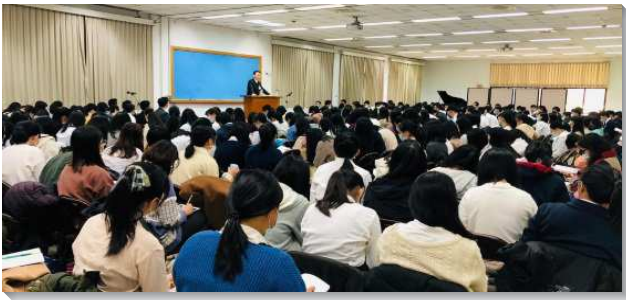
▲大學聖徒冬季現場訓練在三會所舉行

本次進入冬季訓練的約伯記、箴言、傳道書結晶讀經十二篇信息。在信息的開頭揭示，神對付愛祂的人，目的乃是要使他們倒空一切，單單接受神，作他們所贏得的，直到他們最完滿的得著祂。在第四篇信息說到，我們若要得著神，就需要在對的範圍。神乃是要把我們從善惡知識樹的範圍裏拯救出來，擺到生命的範圍裏。弟兄鼓勵學生要喫生命樹，生命樹是宇宙的中心，也是活的人位讓我們來接觸。學生們都滿得開啟，紛紛上台回應，奉獻大學生活要培植生命樹，長出託付，並憑著生命的感覺過團體生活。