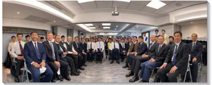
▲八十二會所於二〇二〇年十二月十三日成立

二〇一九年，區負責弟兄們在主的託付中，興起一、二大區各增一個小區的負擔，兩個大區同心合