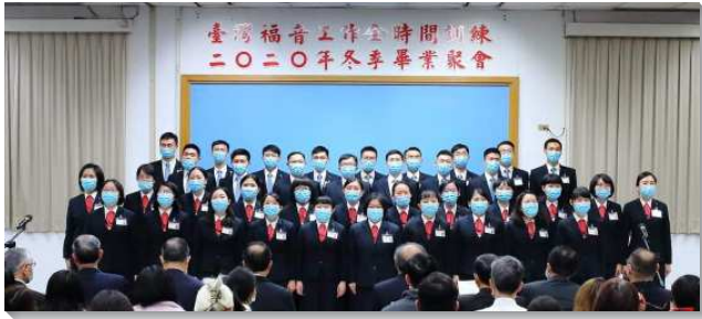
▲全時間訓練二〇二〇年冬季畢業聚會在三會所舉行

台灣福音工作全時間訓練二〇二〇年冬季畢業聚會，於十二月十九日在三會所舉行。本期畢業學員有弟兄十六位，姊妹二十二位，共三十八位學員。雖受疫情限制，與會者需全程配戴口罩，現場的聖徒及學員的親友仍來了近九百位聖徒，加上線上觀看者預估有三千位。今年與往年很不一樣，歷經疫情的影響、世界局勢的改變，以及主忠信的僕人相繼離世，我們深覺主回來的日子近了。兩年的訓練使學員們都有一個心願，在這未了的時代，成為有時代價值的器皿，有分於神終極的行動並作得勝者以轉移時代。這次畢業聚會主題為『作得勝者，此志不移』，說出學員們的心志。