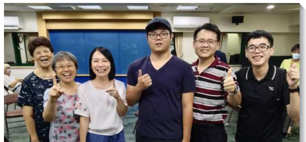
▲聖徒們傳福音得青年人

福音節期後至十月底，是第二階段福音的規劃一週週舉辦福音收割聚會。青職和大學聖徒操練帶福音詩歌和福音短講，同受成全也盡功用。不僅主把得救的人賜給召會，青年聖徒也受訓練為神爭戰。也有幾位青年聖徒見證，他們結了人生中的第一個果子。年初我們向主要三十八個果子，年底，主給我們四十七個果子，阿利路亞！我們抓住機會得青年，收割莊稼過豐年。（姚清元）