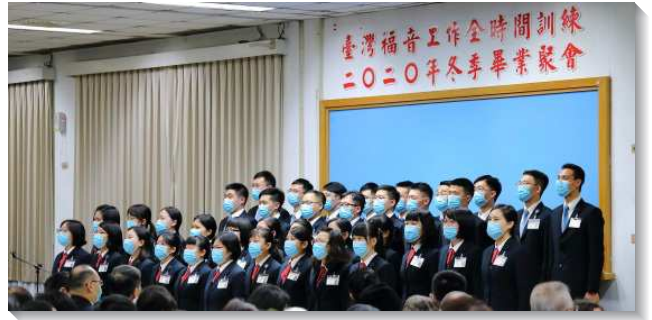
▲畢業學員展覽詩歌

學員們答應主的呼召參加訓練，兩年中受主各面的豫備。在訓練裏，這位親愛的良人天天向我們顯現，並吸引我們快跑跟隨祂。我們學會最重要的乃是向神敞開，