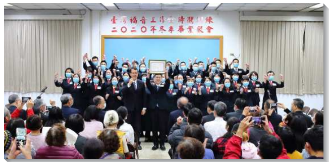
▲畢業學員獲頒畢業證書

為此我們不只領受神聖的啟示，更操練週週十二小時實行神命定之路、五週的福音開展、以及活力排的實行。進一步我們看見，不僅自己實行，更要『成全聖徒』，使眾人有分建造基督的身體，因為得勝者並不是單獨的基督徒，乃是一班受成全並成熟的神人，過團體的生活。藉著與聖徒在一起禱告、配搭，成為活力伴，就在開展上產生衝擊力，帶下主的祝福。我們願意一生都活在身體裏，寶愛身體、受身體的約束，並在各地召會配搭盡功用，帶進基督身體的實際，有分神的經綸。