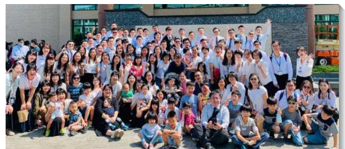
▲聖徒們踴躍參加青職特會

也有許多青職聖徒，提早訂好南投中部相調中心附近的民宿，提前一天抵達相調中心，就為了準時參加第一