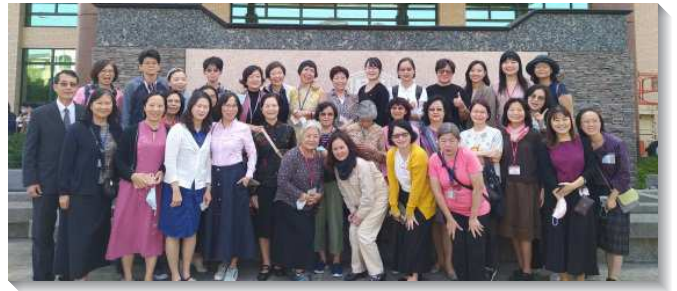
▲聖徒們參加第二梯次全台姊妹事奉集調

信息中說到在主即將第二次來臨之前有許多的兆頭，看見敵基督的作為、人真實的光景，我們需要注意、小心。但我們的眼目不該只是定睛在消極的兆頭上，我們乃是要更積極的看見：『這國度的福音要傳遍天下，對萬民作見證，然後末期纔來到』（太二四1），也看見『…可以從無花果樹學個比方：當樹枝發嫩長葉的時候，你們就知道夏天近了；…正在門口了，』（太二四32）。姊妹們一面從以色列的復國看見主回來的腳步近了，一面姊妹們也奉獻自己，為著加速主的回來，願意與主的行動配合，作精明的童