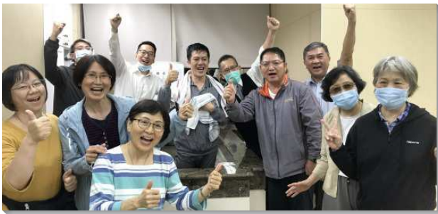
▲壯年班聖徒在台北六會所帶人得救

在台北市區內開展的四隊，一週得著二十二人。無論是馬路福音、叩訪生門熟門、或福音餐廳，學員們都藉禁食和同心合意的禱告，放膽傳講。五會所有位年長姊妹，數十年來到公園送氣球給小朋友，這次學員接觸到一位二十五歲的青年人，他當年拿過姊妹送的氣球，至今他仍然認得這位奶奶，所以他向神敞開並受浸了。