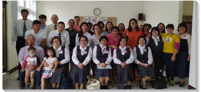
▲壯年班聖徒至彰化溪湖傳福音

雲嘉南四隊，一週得著三十二位新人。在窮鄉僻壤的古坑，有人拿到福音單張，主動前來會所受浸；有行動