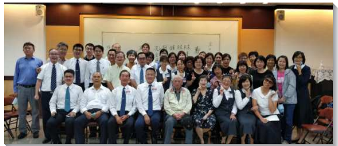
▲壯年班聖徒至屏東潮州福音開展

馬祖地區是壯年班首次此來傳福音，本次得著五人。當地滿了偶像，家家都有供桌，所以學員們更迫切的爭戰禱告，運用主的權柄捆綁惡者，受浸的新人，幾乎都是前後判若兩人，成為主在馬祖最美好的見證。