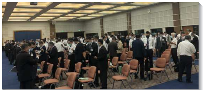
▲ 弟兄們於聚會中分享交通

的權柄，在神聖奧祕的範圍裏向奧祕的神禱告，站在基督升天的地位上，照著神的願望和思想，發出寶貴的、有分量的且震動陰府的禱告。這種禱告是有效能的禱告，推動神的旨意，執行神的行政，甚至就是神的行政。這樣的禱告也把我們帶到第六篇，召會生活的高峰——基督身體的實際。我們需要智慧和啟示的靈看見基督身體的實際。得勝者乃是基督身體的實際，得勝者是得成全並成熟的神人，是今日耶路撒冷裏的錫安。主的恢復是要建造錫安——得勝者作基督身體的實際，終極完成於新耶路撒冷。為要與其他肢體一同活在基督身體的實際裏，我們需要有基督身體的感覺，並且藉著相調將眾人引進基督身體的實際。