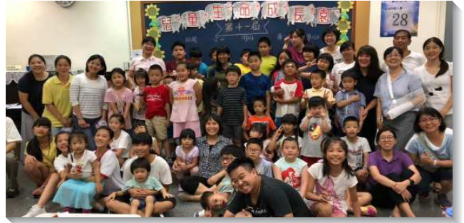
▲聖徒們與兒童們參加生命成長園

在九月份期初特會前，大學聖徒就豫備自己，藉著追求馬太福音而進入期初特會『國度的實際與國度子民的