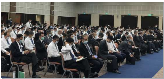
▲ 秋季國際長老同工訓練於中部相調中心舉行

既知道這世代的終結，我們的基督徒生活就需要第二至四篇信息來加強。第二篇說到我們需要作精明的童女儆醒豫備。我們要儆醒並豫備自己，好使我們能在大災難之前被提。作精明的童女不僅燈裏要有油，器皿裏也要有油，我們不要作愚拙的，反倒要天天出代價為自己買油，然後才能用油供應人。