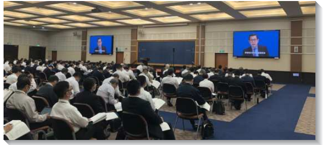
▲ 聖徒們進入秋季國際長老同工訓練信息

第五至第六篇主要是關於召會生活。第五篇論到召會的禱告需要是時代的禱告，第六章說到召會生活的高峰——基督身體的實際。第五篇論到召會作禱告的殿要有時代的禱告。時代的禱告乃是召會作為基督身體的禱告，這種禱告運用基督這升天之主和身體之元首