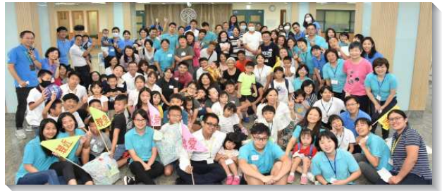
▲聖徒們參加暑期親子健康生活園

並顧到孩子的需要。其中有個關是『傾聽畫作』，家長需要戴上眼罩，在吵雜的環境下，學習傾聽孩子的聲音，讓孩子引導家長前行的方向，走到定點完成畫作的任務。在過程中家長需要專注於孩子的說話，信任孩子所給的每一步指令，藉此學習謙卑、體諒並俯就孩子。透過這個活動讓許多家長蒙光照，父母若在日常生活中缺少傾聽孩子的聲音，就容易造成生活上的誤解與隔閡，互動也就越來越少。藉著這活動體驗使家長能學習停下來，傾聽孩子的說話，彼此有良好的溝通與聯結。