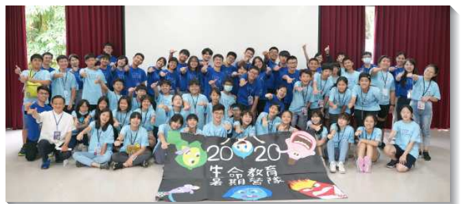
▲少年們參加生命教育體驗營隊

在營隊開始前，隊輔們聚在一起禱告、歡唱詩歌並分享對營隊的期許，不僅凝聚團隊向心力，更做好準備期許能發光發熱。營隊共有四組，大學生彼此分工合作配搭合宜，使營隊進行順暢。課程則有人與己、人與人、人與環境、人與宇宙四方面。在課程中，隊輔帶領小隊員認識情緒和其功用，並透過溝通及合作的練習，學習在人與人之間有真實、有效的互動。此外，也從生活的角度，看見人之於生態環境該如何共存、共享。最後帶領小隊員設定目標，奮力向前。還有許多精彩的活動，幫助小隊員將所學落實於生活中。大地遊戲和角色扮演則是營隊的精髓，促使小隊員突破個人平日舒適圈，與同伴互信互助、齊心合作以達目標。晚會表演及隊劇更幫助許多小隊員突破害