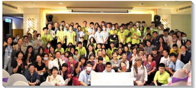
▲得榮基金會舉辦得榮少年獎助學金頒獎餐會

今年暑假如期舉辦第八年的生命教育體驗營隊，透過成果展的影片和二位得榮少年及二位大專生的分享，期勉在座的少年們，學習做個樂意付出自己、回饋他人、懂得感恩的人。餐會未了，基金會劉弟兄肯定少年們的表演，能勇於呈現自己、激勵他人。同時也勉勵在座每一位少年，每個人都是重要且是有價值的。期盼將來藉著基金會的各項活動，培養更多對社會、環境、自身有最大益處的得榮少年們。（楊厚禾）