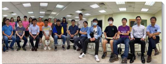
▲聖徒們配搭暑期福音開展

讚美主，祂是耶和華軍隊的元帥，帶領我們一起爭戰得勝。暑期開展除了全會所聖徒參與之外，還有七位全時間服事者及學員一同配搭，士氣如虹。七月份的開展不到兩週，藉著馬路福音，已有五位福音朋友當場受浸。從週一至週五，每晚都有約二十位聖徒一同出外叩門。我們的足跡踏遍和平東、西路、羅斯福路、師大路、建國南路、永康街等，總計在七月份共有十八位受