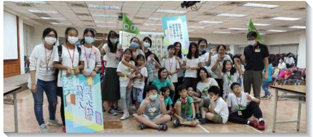
▲親子參加暑期親子健康生活園

我們在每週三的事奉交通中持續禱告，把每個家的情況帶到禱告中，靠著聖靈的能力，得著關鍵的家。也主動聯絡久未聚會的家長，在生活中顧惜他們，因而恢復一個家，父母帶著兒童過召會生活。神也賜祝福，加給