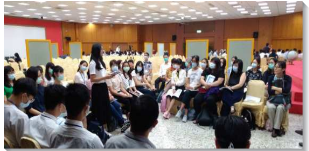
▲ 醫學院的學生分組交通在校園的蒙恩

八月十五日週六中午，聖徒們靈裏高昂陸續從各地抵達會場報到。報到後，聖徒彼此有禱告與相調交通。下午二時正，在『緊緊跟隨救主耶穌，靈中生活