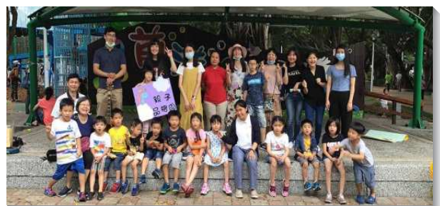
▲聖徒們配搭公園兒童排

每週的公園兒童排也是聖徒相調的機會，各環聖徒都配搭進來，藉著一同交通、禱告、豫備故事和詩歌，將我們享受的基督，傳揚並分賜給人。聖徒們藉著配搭也更有身體的感覺，很生活化的一同享受身體生活的甜美，也將基督湧流出去。讚美主，願主繼續祝福祂的召會，得著弟兄姊妹們，藉著與祂配合而實行神的旨意，使基督的身體得著繁殖擴增。（楊張綺庭）