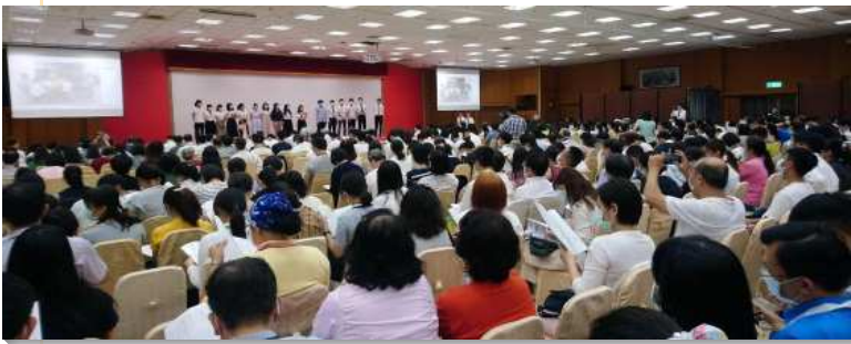
▲ 二〇二〇年路加聖徒集調在台中舉行

接著，有職場分組的蒙恩交通，聖徒陸續上台展覽在各職場的蒙恩，見證這位包羅萬有的基督。聚會末了是海外聖徒的交通見證，弟兄們分別交通在非洲，特別是衣索比亞的開展；歐洲的法國、德國；大洋洲的斐濟與巴布亞紐幾內亞；亞洲的孟加拉和斯里蘭卡，以及中亞五國的蒙恩，讓我們看見全地莊稼已經發白，迫切需要有人前去收割。所以大會總結在一個