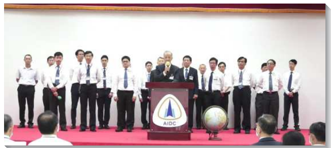
▲ 服事團弟兄們總結的交通

下午的最後一場聚會是校園分組的交通，其主題為『如何在繁忙的課業中贖回光陰、裝備真理並湧流生命』，其中有從非洲來台就讀醫學的博士生與從大洋洲的巴布亞紐幾內亞來的聖徒之感人分享，與會者深