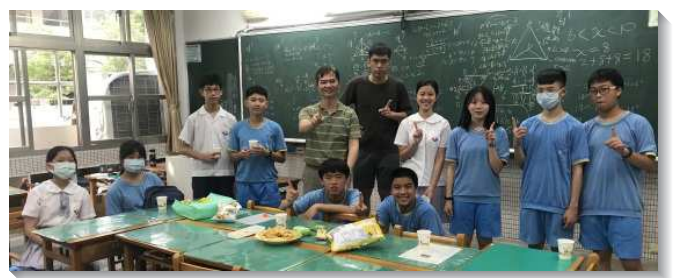
▲聖徒陪伴學生們參加興雅國中校園排

青少年因著追求主話，湧流生命。已過一年在興雅國中校園排，初時成員只有三位，藉著堅定持續的聚集，並一同為邀約對象禱告，青少年漸漸對人有真實的負擔，邀約人來。至今參加過的福音學生有三十位以上，穩定與會的有六位，更有同學每週都期待來小排唱詩歌，願主繼續祝福新學期的校園工作。（楊立誠）