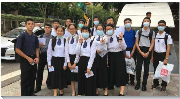
▲青少年聖徒出外福音開展

這個訓練藉著一整週的時間，幫助升高中的聖徒豫嘗全時間訓練各面的豐富，在職事、真理、生命、事奉、基督的身體、性格、心志…等操練上給予成全，盼望每一位高中生都立定心志，於大學畢業後參加全時間訓練，成為主團體的器皿，以滿足主的心願。