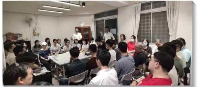
▲聖徒們配搭夏季兩週聯合福音開展

感謝主，在神聖的水流帶領下，我們能有分於聯合開展，願主持續加強我們為這美地有迫切的禱告，使居民們個個轉向主，讓主在萬華地區作王掌權。（施孟萱）