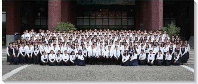
▲二〇二〇年全台高中一週成全訓練

生活方面，學員們每天早晨五點半起床後，便一同呼求主名操練靈。在輔訓的帶領及同伴的配搭下，整理個人內務以及作團體整潔，建立正確的性格。有學員見證，藉著嚴格的內務操練，使他開始學習凡事在靈裏聯於主，也因著與同伴彼此幫助，使他珍貴同伴的寶貴，認識基督的身體。還有學員見證，受訓剛開始不明白為何需要性格的操練，但是藉著訓練的幫助，當他看見平整的床鋪、整潔的寢室，他就蒙光照，看見自己需要在生活中規律的操練性格，不僅是為著正確的屬靈生活，更是要在地上成為神的彰顯。