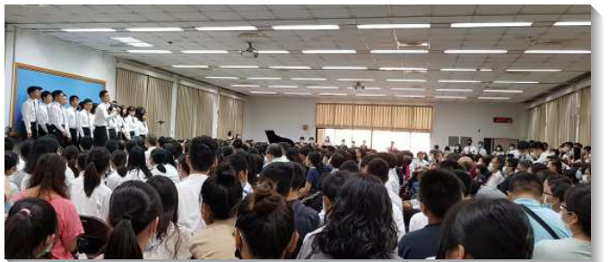
▲青少年聖徒於家長開放日展覽

當週週六上午有家長開放日，家長和聖徒們踴躍與會，見證主在他們身上的成全。每位學員按大區分組上台，展覽他們在這一週所蒙的恩典。有人因看見主復活時將裹頭巾整齊放好的圖畫，而向主奉獻每天要摺棉被，好讓神聖的屬性在人性的美德裏彰顯出來。有人在訓練中因同伴的代禱與激勵，向主奉獻要過晨晨復興、