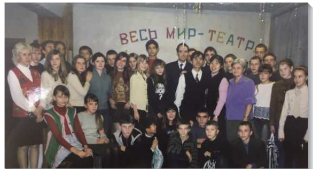
▲聖徒們至小學傳福音

校園服事配搭中，認識在新人裏的一，學習放下自己所以為好的觀念，調進身體的配搭中，在此並沒有台灣人、美國人、俄國人、韓國人、馬來西亞人，惟有基督是一切，又在一切之內（西三11）。我曾經在一次申言聚會中，聽到一位年逾八十歲的姊妹，娓娓道來當週的信息綱要，她靈裏釋放、條理清晰、負擔明確，才知道主在此地豫備了大量真心尋求者為著祂的見證。與聖徒一同搭二十多小時的火車到一個城市開展時，學習受限制躺臥在狹小的臥鋪，在搖晃中與主同安息；在警察隨時會來干涉的情況下，依然喜樂剛強為主站住。我們將家打開，愛筵與我們配搭的外國同工及所照顧的學生，雖然我們的語言的確是受限制，但從他們敞開的反應中，才知道在我們靈中的相調是不受限制的。