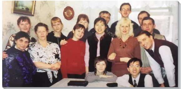
▲鄰近莫斯科城市的聖徒們相調

新人的學習一剛到俄國，首先面臨的挑戰就是語言的學習。那時，在俄國的召會已有十年的時間，弟兄們希望我們能將俄文學好以配合牧養的需要。剛到俄國的前三個半月，天天泡透在語言的學習裏。在學習中才認識自己對吸收新事物的度量須再被擴大，看見自己何等需要再向主倒空，棄絕自己以為有的，靠著祂的恩典繼續往前。每年有五個多月的嚴冬（最冷約零下二十五度左右），當頂著紛飛大雪前去看望聖徒時，經歷到在我們裏面有適應一切的生命。在俄國五年，我們共搬了五次家，使我們稍微體會到『亞伯拉罕因著信，在應許之地作客』，羨慕一個更美、屬天的家鄉，過祭壇帳棚的生