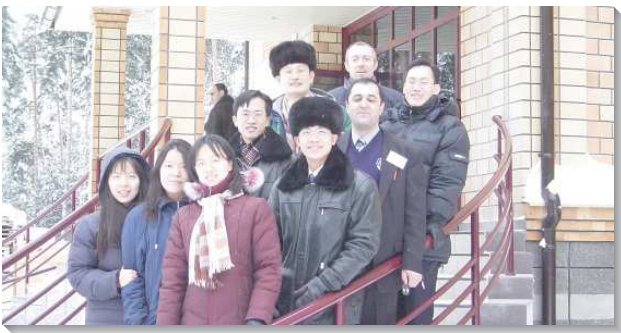
▲二〇〇二年在俄國開展的聖徒們

因著認識職事以及主在全地的需要，當我尋求結訓後的方向時，主引導我報名海外開展，為著祂的需要。那時看見自己實在是一無所是、一無所有，深怕構不上主的需要，但正如林後四章一節所說：『因此，我們既照所蒙的憐憫，受了這職事，就不喪膽。』心想，若能盡上自己微薄的力量，配合主當前的行動，催促祂的再來，豈不是我所願意的嗎？於是便報名海外開展，答應主的呼召奉差遣往全地去，作個誠實愛主的人。經過交通，我和姊妹剛結婚，便於二〇〇二年八月赴俄開展。