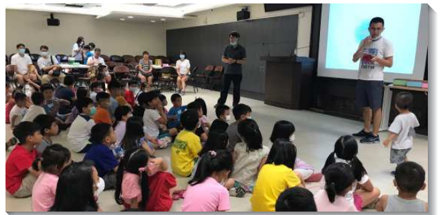
▲聖徒們邀約兒童至會所參加暑期兒童活動

職事的信息說到：『只要我們對人有合式的關切，我們就會漸漸被資格被神使用，使別人得救』。感謝主，暑期的兒童活動讓我們邀約到不少孩子們的同學、社區的鄰居、同事親友的孩子，相信後續對他們親密的關切，必能將他們帶進並穩固在召會生活中。（余宏邦）