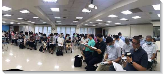
▲聖徒們清早至會所參加禱研背講

一位中壯弟兄見證，他很久沒有好好讀完一本屬靈書報，也覺得清早六點半就開始聚會是不可能的，但藉著參加禱研背講，就有了突破，不但進入完整的結晶讀經信息，也感受到參加這早晨的聚集，使他全人被主充滿。另一位得救半年的青職姊妹住在汐止，為了參加禱研背講，她大約清晨五點就從家裏出發前往會所。她見證說，雖然為了參加禱研背講，需要比往常更早起床豫