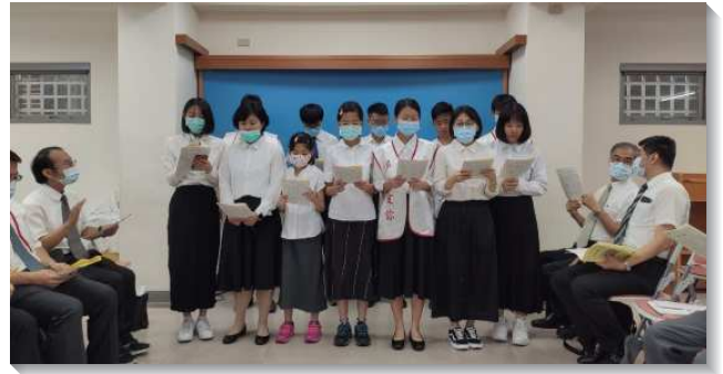
▲畢業生於主日感恩聚會中分享見證

在擘餅聚會結束後，接著是今年的畢業生感恩聚會。與會的畢業生包括研究所、大學、中學、小學、幼兒園，共有十八位。除了請畢業生分享召會生活的見證，會所也豫備了精心設計的紀念襯衫，上面印有『我們一起走過』的文字送給他們。一位大學畢業的姊妹見證，當她得知學校畢業典禮和主日畢業生感恩聚會，正巧是同一日，她心裏很掙扎，不知該如何選擇？主藉著服事過她的姊妹，向她見證自己也曾遇到同樣的情況，但她沒有選擇惟一一次的大學畢業典禮，而是選擇每週一次的主日聚會，這激勵了姊妹。就在她決定要參加主日聚會後，竟然收到她們班的畢業典禮被安排在主日下午舉行。因此姊妹上午可以在會所為主作見證，下午還能參