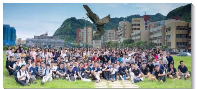
▲大學聖徒參加期末特會外出相調

各梯次亦安排相調的行程，使來自不同大學院校的學生們藉此調去區別，經歷『惟有基督是一切，又在一切之內』（西三11下）。相調中學生們各盡功用，並且愈過愈珍賞、寶愛彼此的那一分。相調也使小羊看見身體的異象，願意更多將自己擺在召會生活中。讚美主，基督和基督身體的豐滿，在相調中彰顯出來，使眾聖徒們能滿有力量，並一同領略何為那闊、長、高、深！