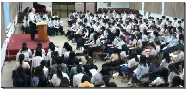
▲大學期末特會第三梯次在三會所舉行

前兩篇信息幫助學生認識世界局勢是主行動的指標，當我們看見世界局勢有許多改變時，我們應當儆醒，並考量主要作甚麼，以及這些改變與我們有甚麼關係。我們必須活在靈裏，作為在地上有神心的人，就是天能向