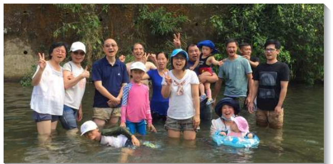
▲弟兄姊妹在溪水中喜樂的相調

另一個小區也藉由分排主日與會後相調，使人人都有負擔要帶人進入召會生活，有位福音朋友被帶進召會生活而受浸得救了，還有久不聚會者，看到聖徒彼此相愛的生活，逐一被恢復。感謝主，疫情雖然使聚會受到限制，然而聖徒的召會生活卻更生活化，有更多的家為主打開，更多的人被調進召會生活來。（孫光廷）