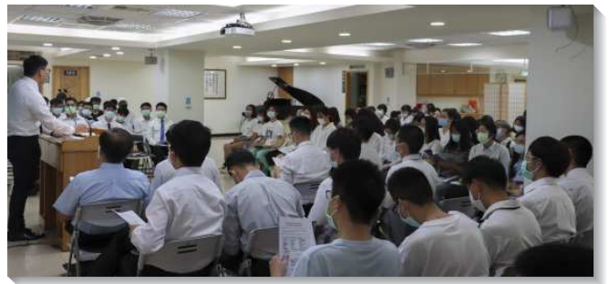
▲大學期末特會第二梯次在四十三會所舉行

在第一、三梯次中，每堂聚會皆安排見證。有幾位弟兄姊妹分享他們曾短期至德國、希臘等國家傳揚福音，當地人驚訝於這群『外國人』向他們講說聖經真理，並藉由這分職事認識主話中的亮光，進而渴慕主恢復中的