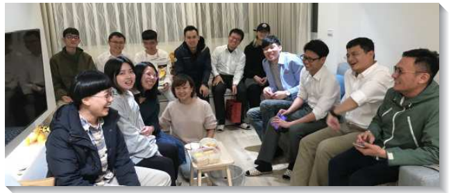
▲聖徒們於小排聚會中交通分享

週一的排聚集能有突破，乃是藉由聖徒多方的禱告，以及聖靈的開路，使我們在身體裏蒙恩。這學期主也加給我們一個聚集的地方，有一對剛成家不久的聖徒願意打開家，為著聖徒排聚集。感謝主多方的賜恩典給我們，使我們學習用全般的智慧，教導各人，好使各人生命長大，能在基督裏成熟的獻上。（賴彥嘉）