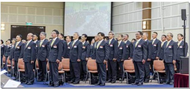
▲壯年班畢業聚會在中部相調中心舉行

在學員們唱出悠揚感人的『讓我愛、奠祭』二首詩歌後，畢業學員們一一作見證。第一組有位弟兄交通，他經過禱研背講的操練，得著變化成全，被真理構成。另一位弟兄在訓練中接受教師們真理的傳輸，並且受到許多同伴的激勵，使他得著復興。有位弟兄服事『搖鈴』，使他學習在主面前作個儆醒豫備的人。一位姊妹在『性格與配搭』課程中看見，自己的天然觀念與能力都是荊棘和癩瘋，她在禱告中向主悔改，甘心受破碎，被基督和那靈充滿，作與人建造的活石。