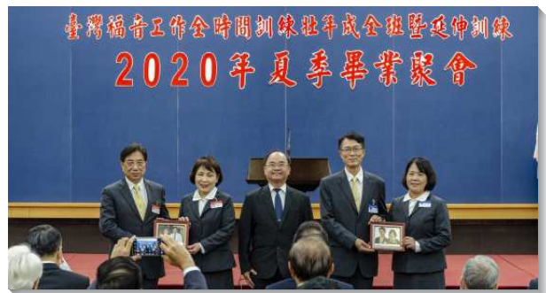
▲壯年班學員夫婦一同參訓代表領獎

在陸續頒發畢業證書以及各種獎項後，弟兄鼓勵各地聖徒，都該放下一切纏累，參加壯年班訓練。因為所有世俗的一切都無法和訓練的價值相提並論，訓練幫助人建立正確的人生觀和價值觀。求主賜給聖徒們智慧的心，知道如何數算自己的日子，贖回光陰，專注於每個當下，剛強開拓，走被真理構成的路，作最有價值的投資，更新奉獻給主，移民為著國度福音的傳揚。