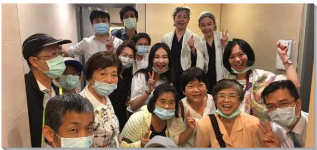
▲福音朋友受浸，眾人喜樂

動，鼓勵聖徒邀約於疫情期間所接觸的福音朋友，在完善的防疫措施下，前往南投清境農場，共一百一十位大人及二十五位兒童參加，含十五位的福音朋友。眾人搭乘四部遊覽車，一起出發，沿路上各車聖徒喜樂的歡唱一首首的詩歌，盡情享受在基督身體中相調的甜美供應。聖徒們分享在疫情期間受限制卻經歷基督的美妙見證，許多人迫不及待交通出積累在心中的感動，何等美妙的圖畫，眾聖徒在主裏相聚，見證交通激勵！