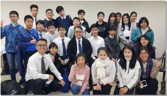
▲聖徒們同心牧養成全青少年

一、學生間的相調與建造：致力營造相互關切、彼此相愛並屬靈互動的空氣。起初由服事者安排週間各種相調、團體讀書、週末入住學生中心等增進平日互動機會；且分別所有假期，規劃讀經營、生活營等成全，更藉著小排生活為主軸，經營學生以及家長核