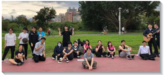
▲青職聖徒們與福音朋友運動相調

雖然今年初因疫情影響，我們無法有大型的聚集，但藉著運動相調和活力組的實行，每次都能邀到不同的聖徒與不同的福音朋友參加。學員們也竭力配搭，讓彼此間有更多聯結。因著愛使我們相聚在一起並與主調成一靈，享受召會生活的緊密配搭與聯結。每當我們與聖徒同聚一起，並調在一起時，我們就更加領略基督的闢長高深。讚美主將我們帶進身體生活相調的實際裏，使我們得享基督豐盛的恩典。（洪靖、林郁菁）