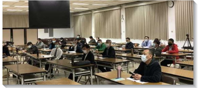
▲大安區弟兄事奉集調分場地舉行

第二堂聚會說到『禱告使神的旨意行在地上』和『過合乎神的心和旨意的生活』。神雖然有祂的旨