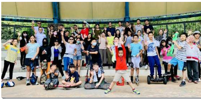
▲聖徒們陪伴兒童到戶外相調

三十七會所聖徒關切兒童的屬靈成長，在去年北投大區的弟兄們交通一系列關於兒童排的負擔並有見證及觀摩之後，聖徒們積極領受負擔，盼望區區都要有兒童排。有些小區並沒有兒童，年長聖徒就將自己家中的孫子帶來，或是到公園裏積極接觸兒童與家長。因此原本十六個小區中只有七個兒童排，現今已增至十四個兒童排。