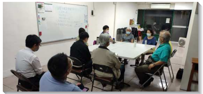
▲聖徒們為購置會所恆切禱告

會所成立進入第三年，聖徒對於購置會所的負擔愈發強烈，藉著申命記結晶讀經，我們看見神的行政並更新對『地』的異象。因著職事信息的幫助，我們的禱告，從原先向主要一個地點，轉為讚美並相信主已經豫備適合的地點，我們只需要去配合主所豫備的。讚美的禱告