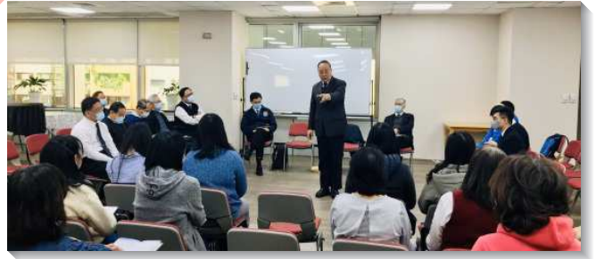
▲聖徒們參加兒童服事者事奉成全聚會

兒童工作最大的異象是『兒童是大的福音』，召會傳福音，兒童是一本萬利的功效。我們要圓一個夢，要得著一萬個兒童。我們要有信心，有把握，這是可以作到的。李弟兄說：『你們就是一家一家的跑，一家一家的開就對了！』作到家家都打開，『一千敬虔家、一萬小神人』要得一萬人，作一千家；要得兩萬人作兩千家。