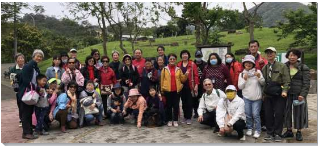
▲聖徒們陪伴福音朋友一同出外相調

會所的第二大區看重身體的交通，一月一日，弟兄們一起用早餐，將一年的開始奉獻給神。大區的姊妹及各小區都有定期及生機的事奉交通。藉著交通，我們深覺得召會需要年輕化，需要得著大量的兒童和青職。