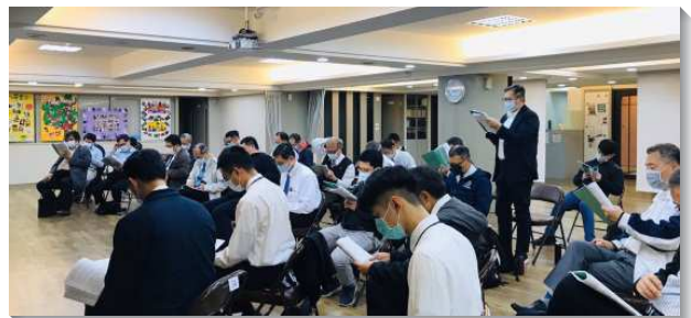
▲城中大同區弟兄事奉集調分場地舉行

第二篇信息更進一步給我們看見，我們需要看見神高大的旨意，我們需要與這高大的旨意配合，承認基督是我們的元首，並有分於祂向召會傳輸的四重能力。弟兄