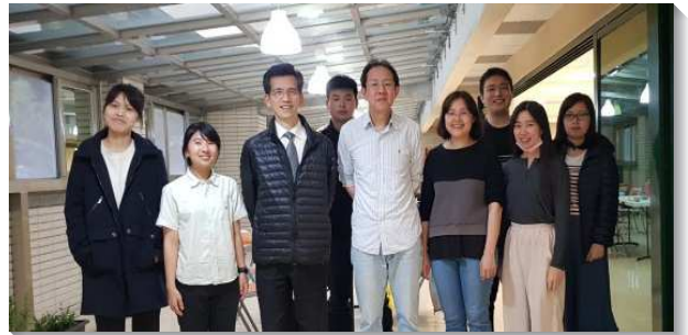
▲ 聖徒們編組服事學員們的飯食

願主祝福聖徒們從主領受負擔，作學員們堅強的後盾，使他們在身體的扶持中沒有後顧之憂，在各開展地作主剛強的見證人。（劉珈泓）