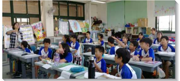
▲聖徒們至各校園實施生命教育課程

生命教育乃是一個方向，可以配合各會所得人、留人、成全人的負擔。期盼各會所的負責弟兄和聖徒們