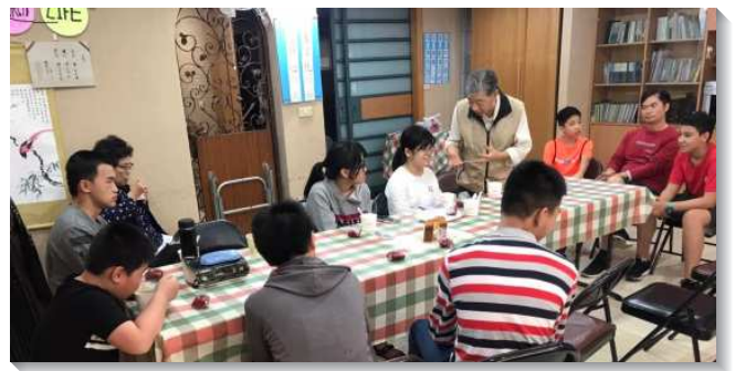
▲各會所聖徒配搭得榮少年學期中公共服務

彼此相見歡，之後至附近公園作清潔。桃園楊梅會所由師大生物系畢業的姊妹規劃服務內容－認識先民的居住地及發展，並協助清理鄰近環境，過程中看見母雞帶小雞的珍貴畫面，讓生長在都市中的少年們驚喜不已。