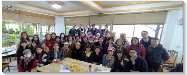
▲聖徒們參加上半年事奉展望交通

在主的話中，眾人一同更新奉獻，向主宣告『我們要作主耶穌熱愛的情人』！盼望我們的勞苦是因主愛