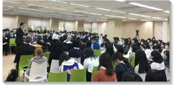
▲大學聖徒期初特會在信基十三樓舉行

第四篇『傳揚全備的福音並照著神牧養』和第五篇『在使徒行傳的繼續裏基督的擴增』，給我們看見，整卷使徒行傳的繁殖是生生不息的。第一章是繁殖的準備，從第二章開始就一直繁殖到第二十八章。弟兄說到，在福音一面需要將『身體獻上』，使基督在地上得著繁殖，使我們都成為基督的『複本』，外面雖