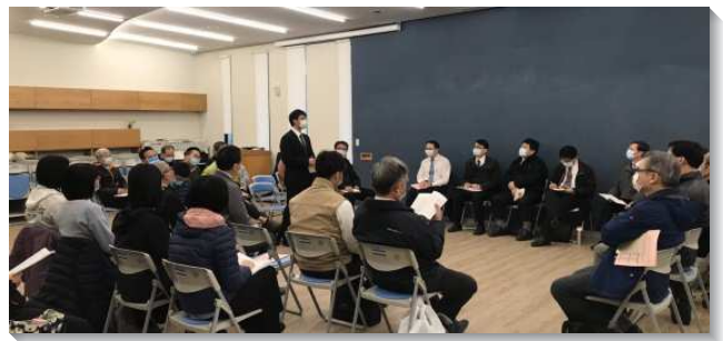
▲聖徒們一同參加展望交通

徒在大型的集中聚會，甚至主日聚會上受了限制，然而增會所的負擔仍在眾聖徒裏面持續焚燒。近日，因著弟兄們大力推動使用視訊的線上會議，聖徒們嘗試運用現代科技，加強彼此間的交通。目前，有部分的兒童排已轉為視訊線上聚集，也有聖徒藉著視訊工具把較邊緣的聖徒帶進禱告聚會和主日聚會的交通中。