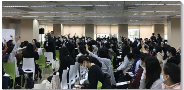
▲信基大區大學聖徒參加期初特會

除了話語的開啟，在兩堂專題中，也帶大家進入實際的操練。專題一『家聚會』，藉著實際的示範，幫助學生們反天然的觀念和老舊的習慣，學習如何運用重讀、重讀、活讀、禱讀，點活人的靈。專題二『讀經、禱告』，幫助學生們看重讀經的重要，願意實行每天能讀一章聖經，和同伴相約一同追求主話。在禱告的交通中領會到禱告不是向神求討，乃是接觸神、得著神，並在神的心意裏禱告。