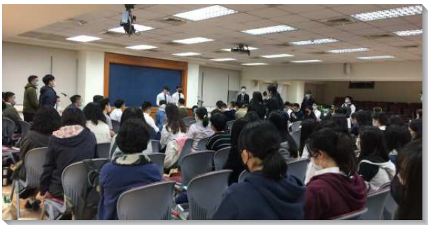
▲大學聖徒期初特會在一會所舉行

第二、第三篇信息『使徒行傳的繼續—藉著同心合意，連同禱告、那靈、話』，點出了這班基督復活的見證人的生活和工作。一百二十位的門徒回到耶路撒冷，冒著殉道的危險，在十天的禱告之中，產生了一個結果，就是『同心合意』。有同伴之間相互的認罪、鼓勵與安慰。不僅如此，他們藉著同心合意禱