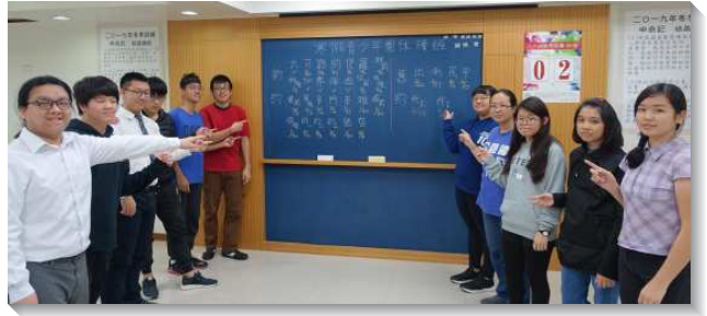
▲青少年於寒假在會所一同讀新舊約聖經

讀經前，服事者擔心青少年不易早起，也沒有長時間讀經的實行，原以為人數會越來越少，但因著特會的熱火持續燃燒，在同伴彼此鼓勵下，沒有人半途而廢。再加上有聖經綱領的適時指導，讀經起來很有享受。