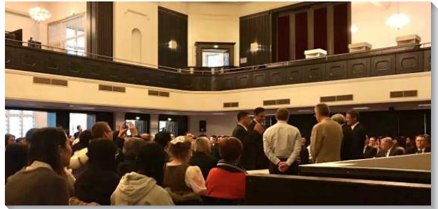
▲聖徒們於漢堡主日聚會中一同擘餅

接著我們訪問柏林、萊比錫、海德堡、慕尼黑等地的聖徒，也參觀柏林新會所，入住美以琳相調中心，在慕尼黑會所擘餅聚會。我們實在看見祂是奮力活動的神，主宰的為著祂國度的擴展，豫備佳美之處，適合眾聖徒聚集相調，並呼召、調度忠信愛祂的聖徒們