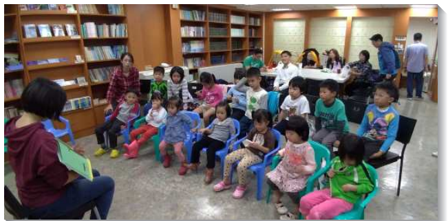
▲聖徒們一同配搭服事牧養兒童

從去年初至今，藉著禱告與聖徒同心合意的經營，親子排兒童人數從七位增至十五位，配搭的家從三個增到七個。願主繼續加強兒童福音的開展，有好的傳承及推動，不僅得著兒童也得著更多年輕的家。（顏毅廣）