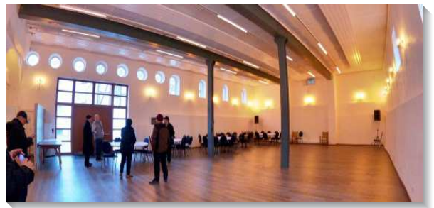
▲聖徒們訪問德國美以琳相調中心

這莊園的部分建築已超過七百年，被政府列為古蹟，因幅員廣闊，原房舍建物裝修費用極大，裝修只