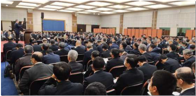
▲全台同工春季成全聚會在中部相調中心舉行

第二篇信息『全心、全魂、全心思並全力，愛主你的神』。神自己設立愛的榜樣，鍾情於祂的百姓，因此我們該獻上我們的愛情給主。愛神，意思是把我們的全人，靈、魂、體，連同我們的心、心思和力量都完全擺在祂身上。當我們愛神，讓這愛父的心在我們裏面，我們自然就能勝過世界，不愛世界及世界上的事。我們需要回想自己是從那裏墜落的，恢復對主起初的愛。因著有起初的愛就能行起初所行的，在服事