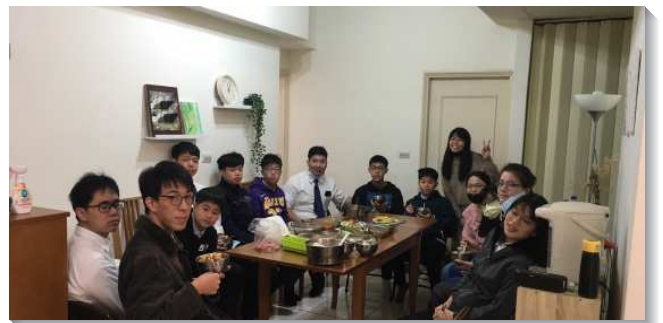
▲學生們一同追求主話裝備真理

學生們不只在會所享受神的話，也操練把主的話帶到弟兄姊妹家中，有小排、主日聚會。我們操練把家打開，接待弟兄姊妹和福音朋友，會前一起豫備，會後一同整潔，學生們一起帶菜愛筵，從青少年到大專生，都