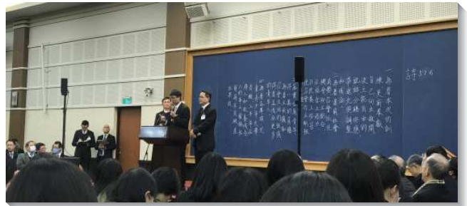
▲弟兄們於全台同工春季成全聚會中分享

爭戰』。我們必須領悟我們與神同工實行神命定之路以建造召會，乃是一場屬靈的爭戰，並且禱告是成就神工作的祕訣。今天我們所做的一切，也就是生、養、教、建，完全是反潮流所作的。因此，我們在這裏乃是爭戰，我們要逆流而上，爭戰著向前。我們必須爭戰，好在召會中產生傳福音的空氣。我們也要從主接受負擔，把召會建造到家裏，這是鐵定的目標，非成功不可。