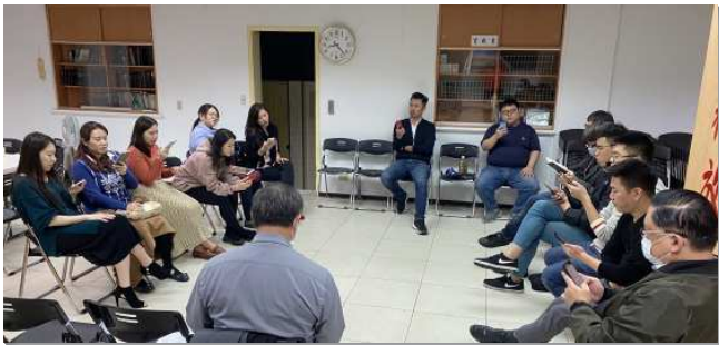
▲青職聖徒們積極追求真理

去年青職特會後，在幾位兄長的帶領下，我們開始編組成軍，先為著青職聖徒恆切禱告，每個小組在禱告聚會和每日晨興後，一同將青職聖徒的光景帶到主前，並學習安靜、等候神，不憑自己的天然作工。沒多久，信