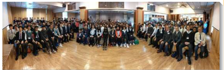
▲文山二、三大區大學暨青少年期末特會

特會的尾聲，弟兄們鼓勵默經滿分者並頒發小禮物。也在所有小羊面前獎勵服事者，讓青少年知道，每場豐富的特會背後，都有一群認真付出的人，並期許青少年都有心願，成為服事者，為神所用。（呂士成）