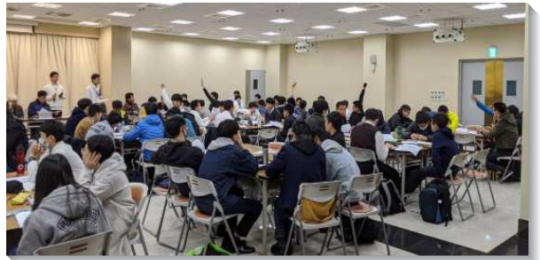
▲北投大區青少年期末特會

參加，另有近五十位青職和大專的服事者一同配搭。特會以真理裝備營的方式追求但以理書，將青少年和服事者分成小組進行真理競賽。競賽內容包含默經及真理搶答。許多青少年從兩個月前就開始認真背經，共有十一位聖徒一字不漏的默寫出近千字的聖經節。