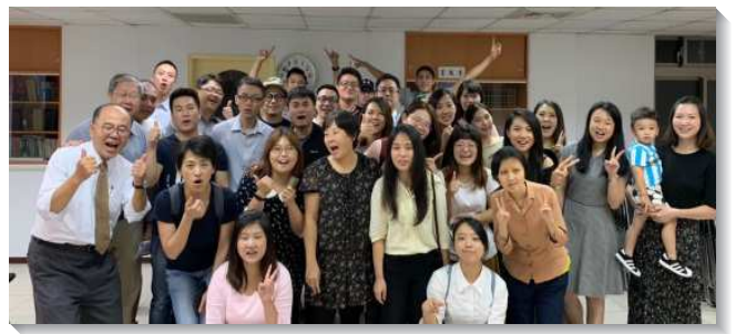
▲青職聖徒在召會生活中相調建造

感謝主已過的帶領，藉各樣的成全及服事，成全青職聖徒，從福音開展、兒童服事、區裏的成全及配搭，將青職調進召會，過團體的神人生活，且有更多青職被神數點，起來承接聖職。展望新的一年，願主得著更多愛祂的人，有分建造的工作，帶進祂的回來。（陳志強）