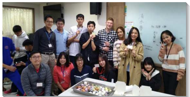
▲聖徒們邀請福音朋友同過召會生活

保羅在提摩太前書三章十五節說：『倘若我耽延，你也可以知道在神的家中當怎樣行；這家就是活神的召會，真理的柱石和根基』。召會是神的家，這是聖徒們真實的經歷。不論男女老少，不分語言國籍，都是神家裏的親人。聖徒們也看見相調的重要，哥林多前書十二章二十四節說到：『神將這身體調和在一起，把更豐盈的體面加給那有缺欠的肢體』。調和就是調整、使之和諧、調節並調在一起。藉著相調，聖徒們逐漸失去區別，更多的調和在主裏。讚美主！基督身體的實際在本會所的聖徒身上正在顯出。（李秉謙）