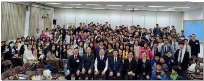
▲國中生期末特會在台北三會所舉行

有別於以往，本次有許多高中生與全時間的弟兄們配搭釋放信息。學生及服事者們在豫備的過程中，經過一次次屈膝主前的禱告，在信心上得加強。學生們經過這次的操練，見證不是只有屬靈裝備豐富的弟兄們才能為主說話，乃是人人都可以為主說話，這真是喜樂的事。