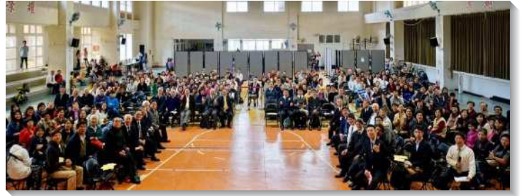
▲七十八會所於二〇二〇年一月五日成立

從宣告到隔年一月增新區開始，原本十多人的區，搬來了兩個家，有幾位新人受浸了，因而成了三十多人的區，經歷了神的祝福與聖徒們同在，因此新的區很順利的成立。並在同年的八月，弟兄姊妹們領受負擔，實行每週兩天的福音晚餐愛筵，從十月至十二月