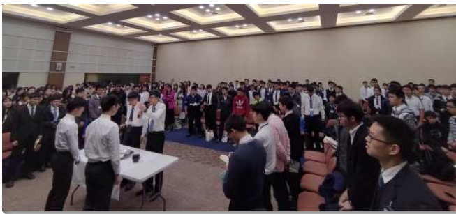
▲高中聖徒期末特會在中部相調中心舉行

第五篇則交通到需要在心思的靈裏得以更新，好叫我們脫去舊人（舊的社交生活），穿上新人（新的召會生活）。最後一篇說到新人的長大與功用，該篇特別強調一個人得救之後，不僅需要得著更多基督供應到他裏面，使他長大，也需要藉著操練，使功用能殼長出來。