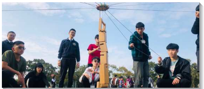
▲高中聖徒專注作體驗活動

此外，特會前兩天的下午時段，特別邀請了具有專業背景的弟兄，為青少年設計了一連串的體驗活動，目標是讓孩子們藉著活動，能對於『新人』這深奧的真理有反思，並能有更深的領會。譬如，有一項活動是要每人用雙手食指托住一根長棍，目標是在手指不離棍的情況之下，把棍子放到地上。目標雖然非常明確，但實際執行時，棍子就是放不下來，原因就是『人位』太多。經過許多失敗和討論，並在服事者引導下，學生們學習藉著顧到彼此，就能使眾人的『人