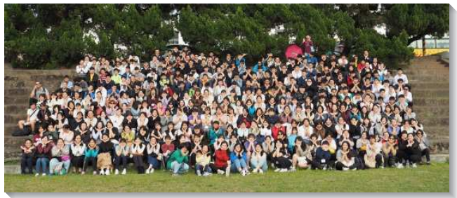
▲高中聖徒們至中興新村大廣場唱詩相調

在第二天晚上的聚會中，服事者帶領青少年，要為著過正常的召會生活有奉獻，青少年們因而認真的在主面前禱告並奉獻：在新的學期分別主日、早起晨興、帶同學進入召會生活並且規律的讀聖經。他們一一寫下奉獻