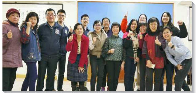
▲學員們與聖徒們在澎湖馬公福音開展

讓小孩子到主這裏來，因為諸天之國正是這等人的一兒童是大的福音，這句話成為學員們親身的經歷。在當今人與人之間常有戒心的社會中，兒童成為福音重要的切入點。台東隊看見有非常多年輕家長帶著孩子至社區公園，因此開始籌辦公園兒童排，藉此得著許多敞開的家長和一群可愛的兒童成為固定班底。雲林隊在幼兒園外面邀約人參加兒童排，一位家長因而主動前來會所，