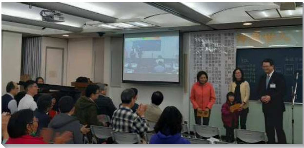
▲士林區聖徒們參加申命記錄影訓練

綸的總綱。摩西這位事奉主者的標準模型，在帶領百姓四十年後，得勝據有地土的前夕，題醒並勸勉即將過河要取得美地、有分神應許的聖別百姓要看重這份產業，他詳述許多他們進入美地後該有的生活、工作、事奉之規範，不可使這地荒涼。