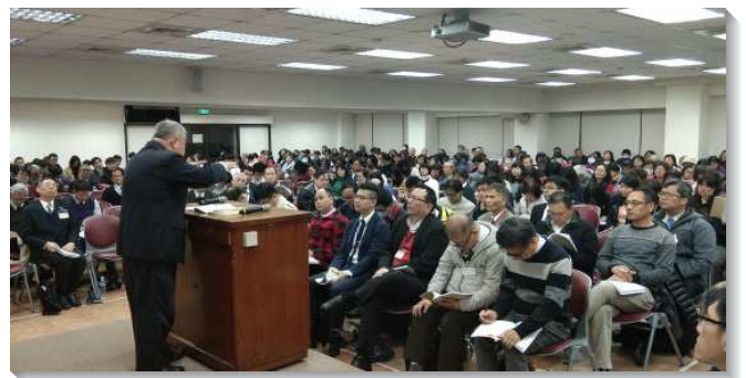
▲城中大同區申命記結晶讀經現場訓練

訓練的晚餐是由各會所聖徒們輪流在愛裏服事，豫備六百多人的晚餐。上午十時，配搭的聖徒們就來到一會所的廚房豫備，分工洗菜切菜，許多剛得救的新人也同來配搭，因著身體的配搭，使得飯食服事更加甜美。大