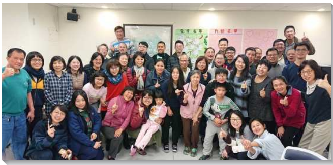
▲學員們與聖徒們在台北市開展

學員們跟隨基督作真元帥，與祂一同爭戰並得著主應許的美地。五週中，總計有四百零二位新人受浸，建立一千五百四十七個家聚會，帶進二百五十七人進入主日聚會，也建立了七個排、三個區。台北市召會七十六和七十八會所，亦在此期間成立，今年還將成立桃園二十二會所。讚美主，祂用繩所量給我們的境界坐落在佳美之處，我們的產業實在美好！