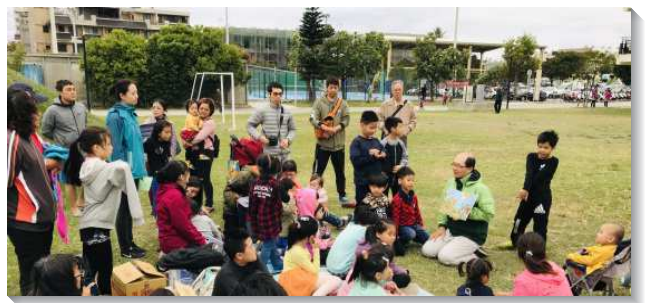
▲學員們與聖徒配搭在台東市公園兒童排

叩門訪人，經歷一個新人的配搭—學員們與聖徒編組成軍，深入鄉里，挨家挨戶叩門，並在居民聚集的據點、街巷接觸人。許多學員在這次開展前從未至鄉鎮開展叩門，亦未經歷在福音朋友家裏為人施浸的喜樂。叩門訪人中，我們經歷主是加我們能力者，使我們放膽往前，更經歷了一個新人的實際。藉著聖徒們長久勞苦所經營的敞開名單，加上學員火熱、迫切的靈，在配搭裏我們領人歸神，得著完整的家，為著召會的建造。