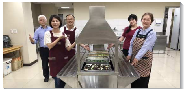
▲弟兄姊妹喜樂配搭飯食服事

的辛勞，若是有第五週的主日，就由弟兄們親自下廚作菜愛筵，讓姊妹們得著扶持、心得安慰。