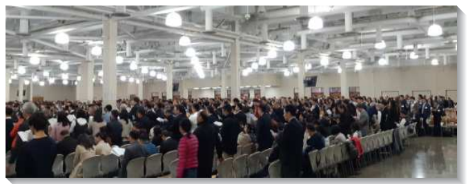
▲ 聖徒們在會中唱詩

這次結晶讀經訓練的關鍵陳述（key statements）如下：『神是藉著基督領祂的子民進入那豫表基督的美地；祂也是藉著基督，就是從神口中所出的一切，在他們往美地的路上維持他們；申命記中的每一句話都是基督，祂如今就是神的話，我們可以接受祂作我們的生命和生命的供應。神的行政乃是公義、聖別、信實、柔細、施愛、憐恤之神的行政管理。因著我們實際的聯於基督這美地的實際，並享受祂的豐富，神的眼目就一直看顧我們，使我們享受神的同在，並使我們成為祂眷顧的對象。那些有資格承受美地的人，認識神的心與神的行政、愛神、信靠神、敬畏神、服從神的管治、顧到神柔細的感覺、並且活在神面前。在召會的入口有十字架；我們要作為召會而聚集，就必須經歷十字架，為著釘死己、攻倒『理論和各樣阻擋人認識神而立起的高寨』、並單單高舉基督，好使祂能成為一切，又在一切之內，為著神的彰顯，並為著一的獨特見證。』