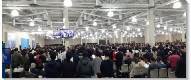
▲ 全球各地聖徒踴躍赴美參加冬季現場訓練

申命記緊接著民數記，可以說是民數記的補充，說明怎樣的人才資格承受神所應許的美地。申命記陳明，享受神所應許之產業的人，該是愛神、敬畏神、服在神