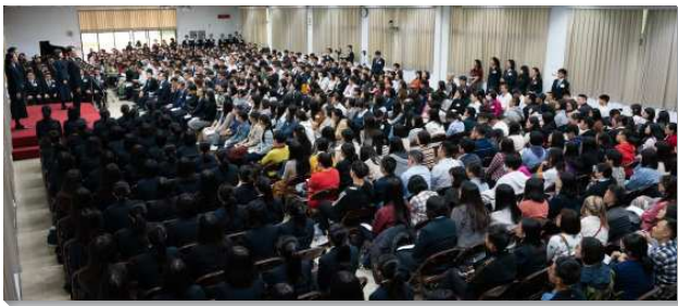
▲全時間訓練呼召聚會在三會所舉行

聚會開始前，學員們引導青年聖徒參觀訓練中心，包括訓練學員寢室、歷史資料館、海外開展展覽館、空中花園，展示學員們所過之神人生活，好使這生命能藉著規律而長大。藉由訓練生活各面的導覽，盼望更多愛主的青年人能切慕有分榮耀的訓練。