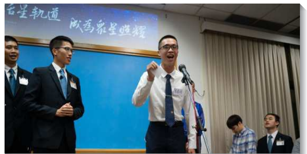
▲青年人上台報號宣告參加全時間訓練

接著，有參訓過的一個家和一位弟兄，分享訓練對他們日後生活的助益。弟兄見證，在訓練中與同伴配搭一起生活、事奉的經歷，定準了他的異象和結訓後所過的召會生活，無論作什麼都需要有同伴，並在身體裏與弟兄姊妹有交通，接受耶穌基督之靈全備的供應。