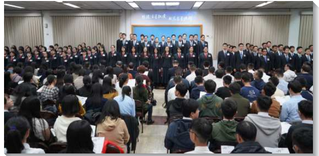
▲聖徒們與學員們合唱詩歌

接著，另五位學員分享他們在訓練中有關：職事、真理、生命、事奉、基督的身體等方面的蒙恩。一位弟兄見證，參訓前對人並無真實的負擔，在訓練中他接觸到一位福音朋友，因家中傳統信仰緣故，遲遲不願受浸，若照著弟兄以前的想法，就會將目光轉往其他福音對象，但在禱告中蒙主光照，他看重福音的果