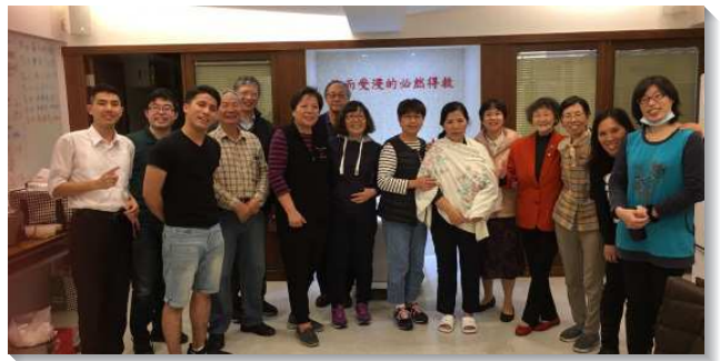
▲福音朋友參加福音初信排受浸

這學期初學員們有負擔，在週三及週六成立福音初信小排，與聖徒們交通後，大家都竭力擺上自己的那一份。弟兄姊妹們在小排中，不僅擺上外面豐盛的食物，也彼此供應裏面豐富的基督，使參加的新人及福音朋友們，裏外都得飽足。主藉著這個小排，一再加給我們果子。學員見證說，藉著弟兄姊妹同心合意的禱告及配搭，主確實在身體裏帶下了祝福。學員們看見他們不是單獨的打仗，乃是與聖徒們在身體裏，為著主在地上的權益，一同爭戰、一同往前。