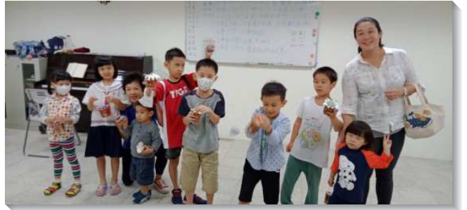
▲兒童們在小排中歡樂成長

在各處尋找幫助。自從有了兒童生命品格園的聚集，使我們在傳福音時成為很好邀約人的憑藉。生命品格園不只給予兒童良好的品格教育，更能將神的生命傳輸給他們，孩童有了神的生命，自然就能活出良好的品格來。