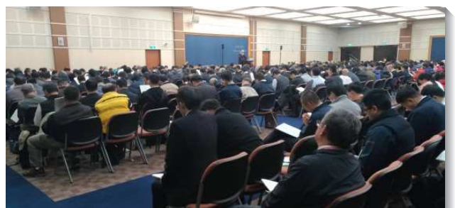
▲聖徒們參加感恩節特會信息暨禱研背講

六會所弟兄們見證，本次有四十位聖徒參加，乃是因著弟兄們重看，率先作榜樣，及早報名不拖延，聖徒們亦分享以過參加特會的蒙恩，彼此傳報好消息，就帶進更多聖徒報名，至終超過原先設定的報名目標。四十一會所弟兄也見證，因著六會所在大區事奉交通提到聖徒們踴躍報名，激勵了各會所。而使一地的蒙恩，也能成為身體的蒙恩。弟兄們把見證帶回會所，鼓勵更多聖徒報名參加，至終也在截止前夕，報名了十九位，是基數百分之十的聖徒共同有分，榮耀歸神。 (劉淳中)