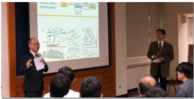
▲城中大同區大學日於一會所舉辦專題講座

第二段的座談由四位大學教授聖徒，回答提問者有關於信仰、人生和召會生活等問題。收回的迴響卡反應極佳；提問者對基督徒生活的疑問得了解答，對信仰問題豁然開朗。願主記念與會者，更深被主吸引並得著！