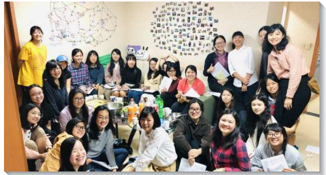
▲大學聖徒邀請小羊與福音朋友至姊妹之家

大於主日晚上，邀請聖徒以聖經福音專題講座進行。講座前一部分先有擘餅聚會，幫助弟兄姊妹及小羊能更珍賞愛我們、為我們受死的主。之後進入專題講座，主題是大學四年中如何過一種『至美的生活』，聖徒以學生時期及考教師時的經驗分享如何經歷神。講座結束後繼續有活力組的陪談，有的組鼓勵福音朋友信主並受浸，有的組邀約福音朋友後續的家聚會及校園排，當晚有近百位的大學聖徒及福音朋友有分。