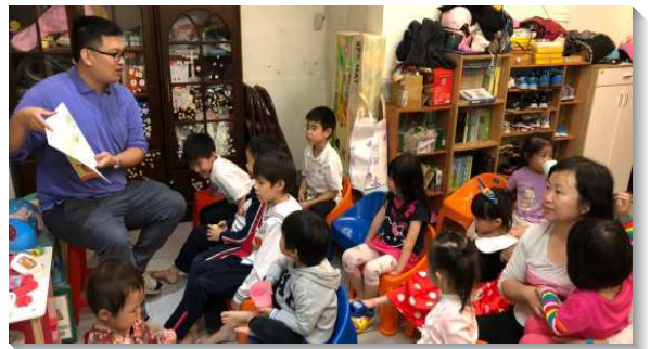
▲家長們配搭服事兒童小排

今年我們在兒童排與兒童主日聚會的實行上也很蒙恩。年初時，幾位兒童家長接受負擔，打開家服事兒童排，顧到召會下一代的需要。我們分別在週五晚上與週六上午各成立一個兒童排，起初是為著弟兄姊妹