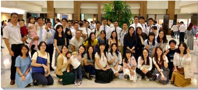
▲青職聖徒們至中部相調中心參加青職特會

在特會前的主日聚會後，全會所的青職聖徒聚在一起，同心合意禱告近一小時，經歷樓房上的禱告。許多人流淚悔改、更新奉獻，眾人都被聖靈充滿並充溢，因而帶進青職的蒙恩：踴躍奉獻，參加訓練。