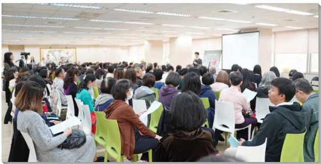
▲得榮基金會生命教育志工分享會在信基十三樓舉行

北市七十四會所的姊妹分享社區中的生命教育。弟兄姊妹在里民活動中心開辦快樂故事屋，透過活動吸引社區孩童、家長。兩年多來接觸了七十二位兒童、三十四個家庭，週週藉著生命教育生動的課程，將生命的美好與可貴，落實到許多家庭生活中。