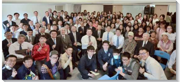
▲七十五會所於十一月十七日成立，啓用聚會

為新增會所，弟兄們這一年來有許多交通和禱告。大安區的聖徒們，亦自十月起有密集聯合福音開展。每週三、週五晚上及週六下午，聖徒一同外出訪人，並於週六晚間有福音聚會。聯合開展期間，每時段都有超過三十位，累計五百位聖徒人次配搭，並叩完新會所範圍四千四百戶居民，得著二百位敞開名單，還有住戶直接受邀到會所受浸得救。這段期間的開展，我們能見證這地