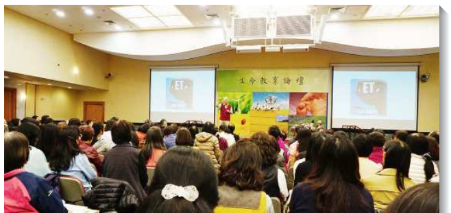
▲專家學者分享生命教育的內涵與智慧

第三位是中華科技大學文創與數位多媒體系曾老師，主題為『十二年國教生命教育素養與本質—以數位多媒體為例』。生命教育的本質是『生命』與『愛』，而其基要核心乃是持守信心與信仰，回到生命的源頭與脈絡，讓愛不斷湧流，以落實十二年國教以生命教育為核心素養的願景。