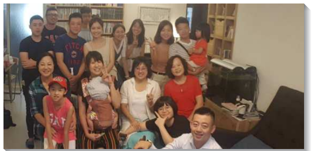
▲聖徒邀請親友參加在家中的福音聚會

在有一次小區的福音聚會裏，有八位聖徒，分段配搭向受邀來聚會的家人們，傳講人生的奧祕。會後，出乎眾人意料，竟有兩位聖徒的母親，均表示願意受浸。她