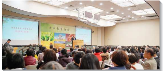
▲得榮基金會生命教育論壇在信基大會場舉行

當日下午則邀請到專家學者至信基大樓地下二樓舉行生命教育論壇，期使弟兄姊妹和所有關心生命教育之人士，在生命教育的知能與實務上得到專業的加