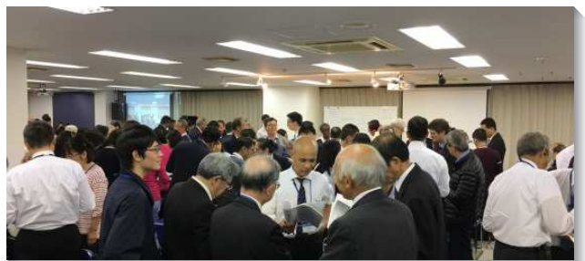
▲聖徒們在會中分組交通分享

此外，已過一年，主藉著身體的禱告，在亞塞拜然、不丹和東帝汶有了突破。在西亞的世俗回教國家亞塞拜然，聖徒們在接觸人和書報推廣上都經歷主的開路。在南亞的佛教國家不丹，陸續有尋求神的佛教徒受浸得救。在東南亞的天主教國家東帝汶，也有尋求的基督徒主動與我們聯絡，盼望有人去訪問他們，使他們有分基督身體的交通。