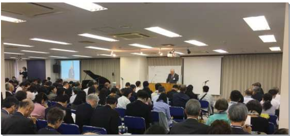
▲主在亞洲的行動特會於日本東京舉行

首先我們看見，主的恢復不是一般基督教的工作，因為我們有主特別的呼召，回到神經綫的中心線，有