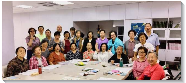
▲聖徒們和壯年班學員一同開展

主日的福音聚會是這次開展的重點，擘餅聚會後分在兩個場地舉行，學員們準備申言、見證、信息分享，更