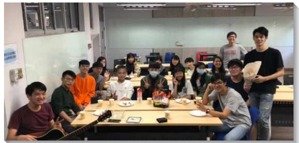
▲師大學生們陪同小羊參加校園排

尤其蒙恩的，是大學服事。七十一會所與三、六十二會所一同配搭，服事師大的弟兄姊妹，以及在師大校園的福音開展工作。這學期住在師大學生中心的弟兄姊妹有五十七位，在本會所過召會生活的有十六位。除了全時間服事者之外，會所有十一個照顧家庭，配搭照顧學生們，關心他們的屬靈情形、課業及生活。在週全的配