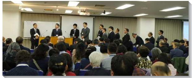
▲弟兄們回應聚會信息的負擔

最重要的是要與代求的基督是一，而有金香壇的禱告。屬靈的爭戰完全是生命的事，是藉著分賜生命叫死人活起來。所以我們要為著在生命裏長大成熟有急切的禱告，好帶進編組成軍。神渴望信徒被建造成為基督生機的身體，與神一同爭戰。神的軍隊是團體的事，我們都必須學習配搭的功課，成為團體的約書亞。一切屬靈的工作都是爭戰；傳福音、造就聖徒、治理召會和禱告，都是爭戰。今天我們需要為著基督