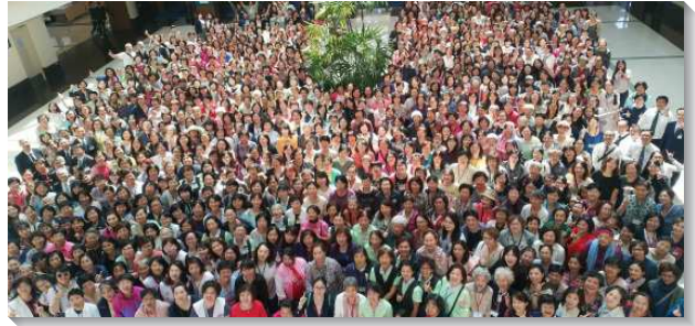
▲ 全台姊妹們踴躍參加事奉集調

人』的信息，當時聖徒們的領會與經歷非常有限。而四十二年後的今天，在環境上、真理的啟示上、召會生活的實行上，都已經豫備好。今天就是新人實際出現的黃金時刻。許多姊妹們多年都在主的恢復裏並忠心跟隨，仍可能在所是上缺少穀多變化。弟兄以歌羅西書三章十一節說明，基督是一切，又在一切之內，也可譯為：基督是一切的肢體，又在一切的肢體之內，這指明一個新人的實際要顯在我們中間，就需要我們每一個人（肢體）都被基督充滿，沒有一位該留在舊人裏。而在日常生活的經歷上，最實際的就是我們的說話，跟選擇。我們的說話，是否是新人的說話？我們在購物時，究竟是舊人在選擇，或是新人在選擇？這些都關乎我們是否以基督為人位來生活。