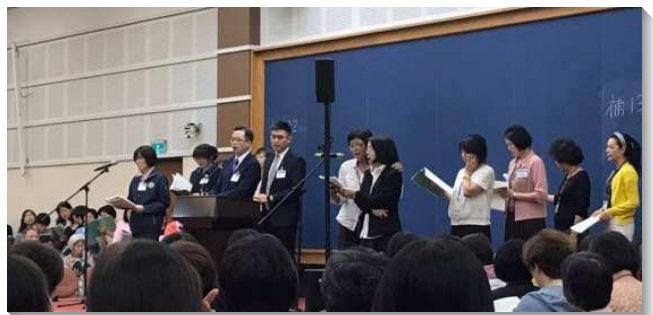
▲ 姊妹們積極回應並上台分享

特會專題交通的重點：分別是鼓勵姊妹們追求李常受文集與牧養。來自各地召會的姊妹們都有豐富的見證。在追求文集方面，有姊妹見證每天安排三餐飯後的時段進入，一天讀三篇。另有姊妹與同伴組成追求小組一同進入，也有姊妹天天與家人同讀，過程中與主有許多交通，並受感流淚，而常保守心思置於靈。