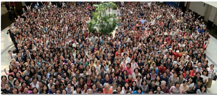
▲ 全台姊妹集調分五梯次於中部相調中心舉行

信息主題是『一個新人成就神創造人的定旨』。共有九堂信息和兩堂專題交通。前三篇信息重在啟示和異象，後六篇重在實行與操練。第一篇是『神永遠的定旨與一個新人』，重在從神定旨的角度看一個新人的豫表與圖畫，就是要完成神造人雙重的定旨—彰顯神並代表祂。第二篇為『基督作為人子、第二個人以及末後的亞當，成就神創造人的心意』，指出受造之人的始祖亞當犯罪而墮落，沒有完成這定旨，而基督作為第二個人，乃是完成神定旨的原型。第三篇是『一個新人的創造與產生』，說出基督為了產生複製，上了十字架以創造新人。第四篇是『為著一個新人，接受基督作我們的人位』，說到新人既已創造完成，我們要有分新人的創