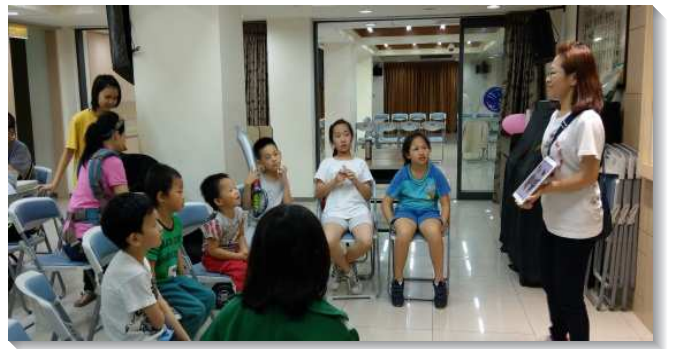
▲聖徒們配搭服事兒童排

藉著家長和兒童服事者們的相調，肢體間的連結更緊密，且在社區開展中結合兒童福音和送會到家，各環相顧，在同心合意中帶進繁增的祝福。（張品潔）