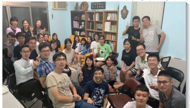
▲聖徒們一同配搭師大福音