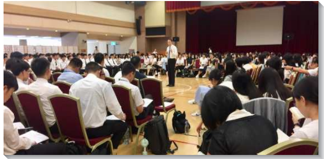
▲大學生們專注進入特會信息

聚，聖徒們分享在日本開展、牧養的見證。他們堅定持續在人身上勞苦，面對不敞開、沒回應的對象，仍然持續的關心、代禱，至終就經歷主藉著環境將人尋回，姊妹還入住姊妹之家，甚至有三十年未聚會的聖徒恢復生機的功用，也加入了傳福音的行列。這些見證皆使眾人得著莫大的激勵和挑旺。