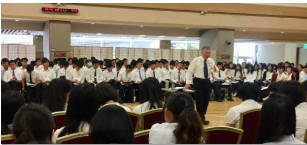
▲大學期初特會在林口養身村舉行

特會內容以約翰福音為主軸，總題是『約翰福音中的生命與建造』。信息共有五篇，傳輸四項的負擔：首先，約翰福音一至十二章關於『生命』的話，竭力過追求的生活，並加強關於喫（約六章）、喝（四章、七章）及呼吸（二一22）的享受。其次，在『建造』一面，操練過團體神人生活，以約翰福音十二章筵宴之家的圖畫，陳明今日召會生活的小影，在這裏主得安息、得滿足，我們也盡上自己的功用。第三，要作約翰福音十五章葡萄樹上的枝子，有正常結果子的路，過『福音』的生活。末了，在約翰福音二十一章主升天前的託付，乃要我們『牧養』祂的羊。因此，『生命』、『建造』、『福音』和『牧養』的負擔，貫穿整場特會。