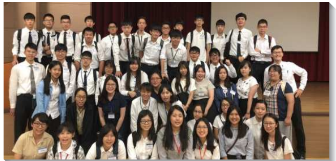
▲各大區的大學生們參加大學期初特會

在聚會的奉獻時段，學生們以個人或活力組為單位，上台向主奉獻：要花時間過喫、喝、享受主的生活，出代價走福音和牧養的路！學生們按著校園分組，認真的尋求本學期各項屬靈操練的目標，並向主禱告，加強對同學和校園的負擔。因著各大區所展覽