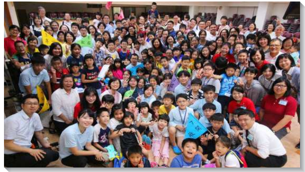
▲城中大同區親子健康生活園在一會所舉行

這次的聖經人物榜樣是尼希米，在他身上看見：一、專的性格，作事情必須專一不散漫，使力量集中，成果自然就會好。尼希米和以色列人建造城牆時，不顧仇敵的嗤笑和凌辱，用心作工，城牆就連接起來。二、公的性格，是指公眾的公。尼希米在重建耶路撒冷城牆以完成神經綸的事上，不單獨，不自私，不尋求自己的利