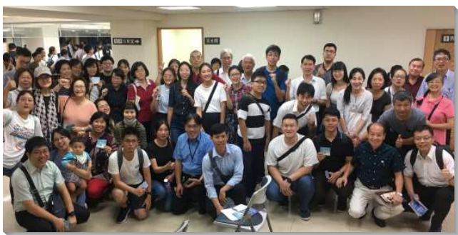
▲聖徒們編組成軍一起出外傳福音

為此，自八月十四日開始，弟兄姊妹都編組成軍，在每週三、五，甚至週末晚上，每人每週至少分別兩小時，一起外出傳福音。三天後，就有一位大學生被邀約到會所，簡單的受浸得救了。下一週，有青職因著參加小排聚集後就得救了。再下一週也有青少年，參加了福