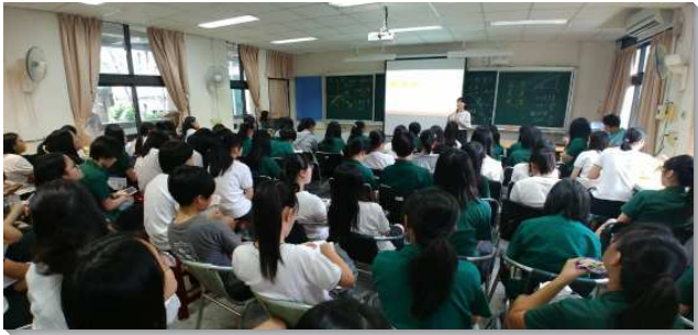
▲聖徒們配搭北一女校園福音講座

福音講座前，學生們除了為自己班上的同學提名代禱；同時也自行設計海報，附上報名連結，張貼於教學大樓各樓層的樓梯間。並於講座前一週，利用中午時