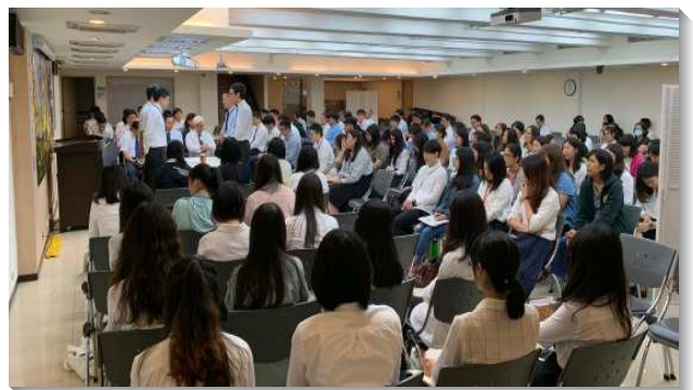
▲大學聖徒和青職聖徒參加特會

此次特會共有一百餘位大學和青職聖徒全程與會，另有四、五十位青職因受工作或照顧孩子的限制，採選修方式進入。無論如何，都叫眾人在身體的配搭裏，竭力追求，彼此供應，不僅大學聖徒得著經歷的供應，青職聖徒也因主話的洗滌而得復甦，可謂雙贏。期盼這樣的追求能繼續精進並持續，為大學、青職聖徒開闢一條共同追求基督、享受主話的活路。 (于文瀾)