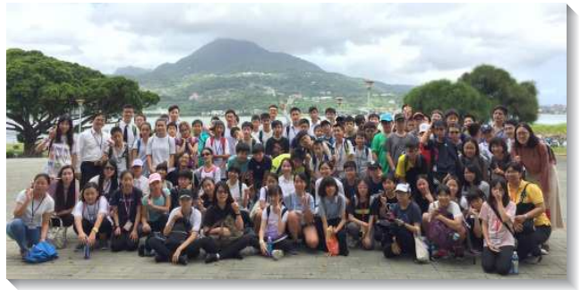
▲國一聖徒成全聚會於忠義訓練中心

主名、禱讀主話。在這段時間中，眾人的靈都被挑旺起來，充滿聖靈中的喜樂，就自動並樂意的向路人傳講人生的奧秘。有三位小姊妹積極向人傳福音，差點就帶一位老先生受浸。學生們單純、竭力的靈，令人珍賞。他們迫切積極向人分享基督的喜樂，實在叫我們受激勵。