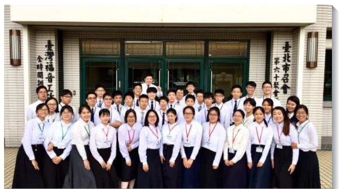
▲高中聖徒成全聚會於忠義訓練中心舉行

當晚有奉獻聚會，學員們經過長時間的禱告、尋求寫下了奉獻心願書，並且主動的在眾人面前慎重宣讀奉獻書，最後在台上將其投入奉獻箱。每個人對於世界的貪戀，對於主的不冷不熱，對於前途的打算，以及對於魂生命的保留，一項一項在主前更新奉獻。我們深信事奉主的心志在他們身上正冉冉升起，願神在他們身上得著完全主權，個個都作轉移時代的青年人。（張至安）